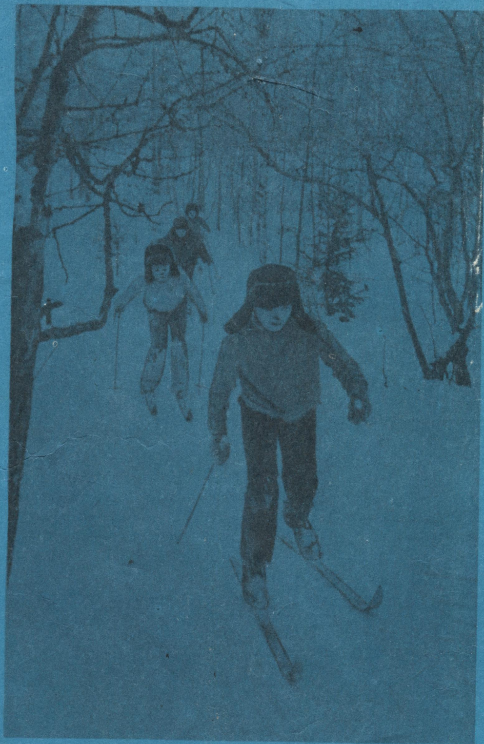
Тӧвсѧ каникулъѧс дырйи.