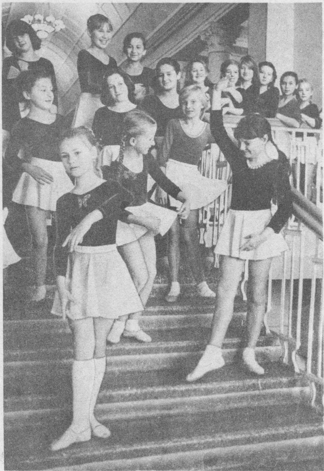
Нимкодъ лӧсыда йӧктыны.