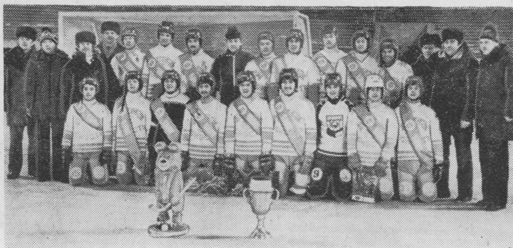
Омскысь «Юность» команда. Ворсöмьясын сийö петис первой местаö да лои высшöй лигаын.