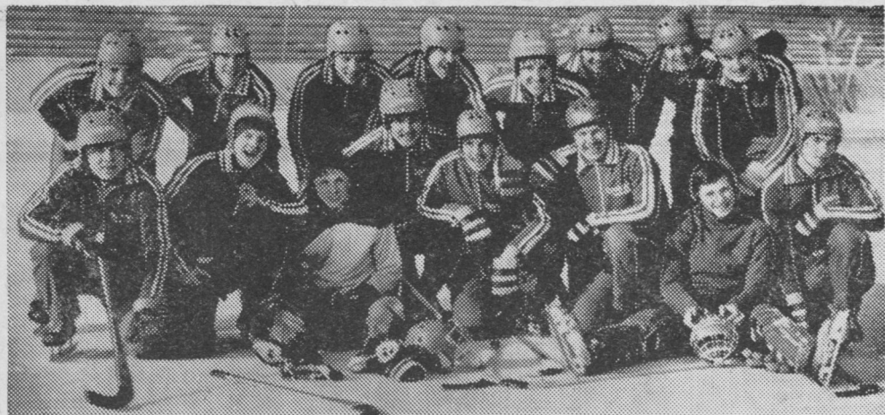
Сыктывкарын вöли мача хоккейöн СССР-са чемпионатын ворсысь первой лигаса командаяс костын финал. Миян «Строитель» команда ворсöмьясын босьтис мöд места да петис высшöй лигаö.