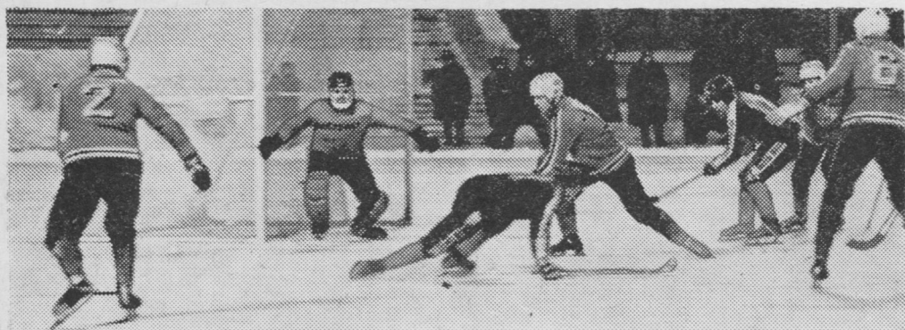
Ворсöны Сыктывкарысь «Строитель» да Омскысь «Юность» командаяс.