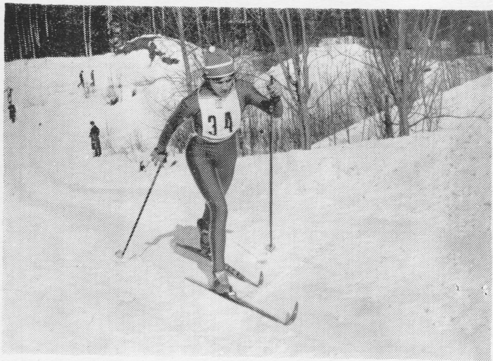
Дистанция вылын куймысь олимпийской чемпионка Раиса Сметанина.