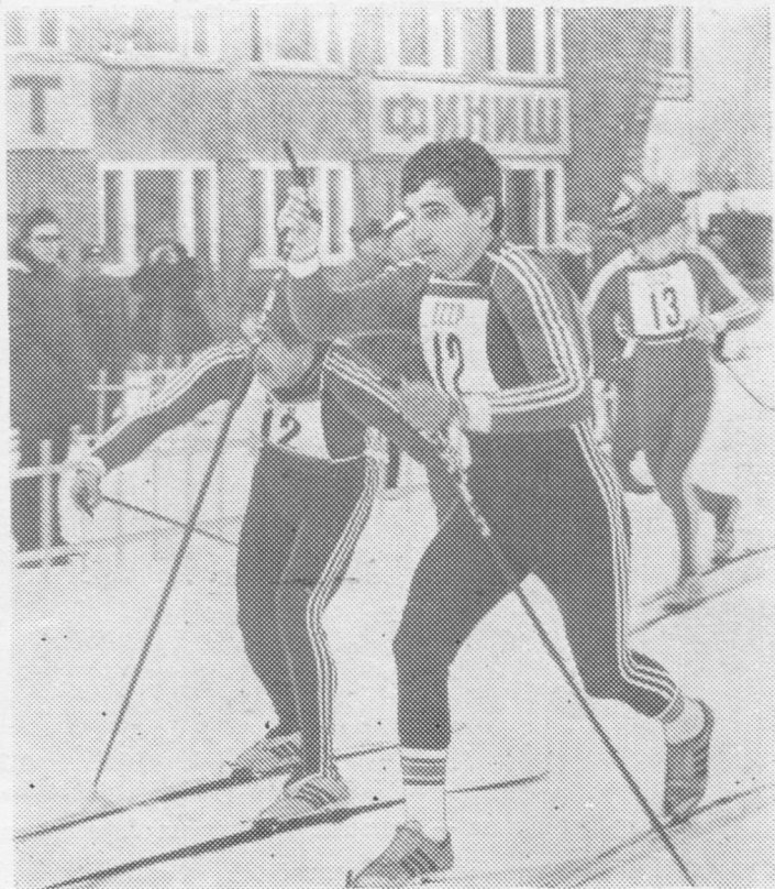
Эстафета босьтö Николай Бажуков.

Кыкысь олимпийскöй чемпион Николай Бажуков 15 километра лыжня вылын босьтис зарни, а эстафетаын — бронза медальяс.