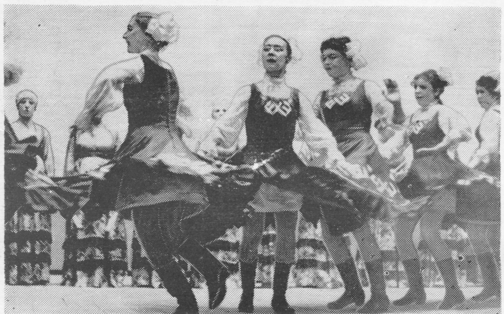
Ийктöны сиктса нывъяс.