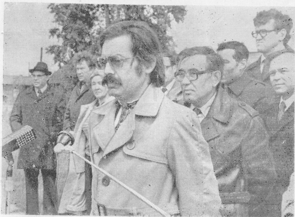
Карпат сайса поэт Петро Скунц лыддьё ассьыс выльён чужём кывбурсё.