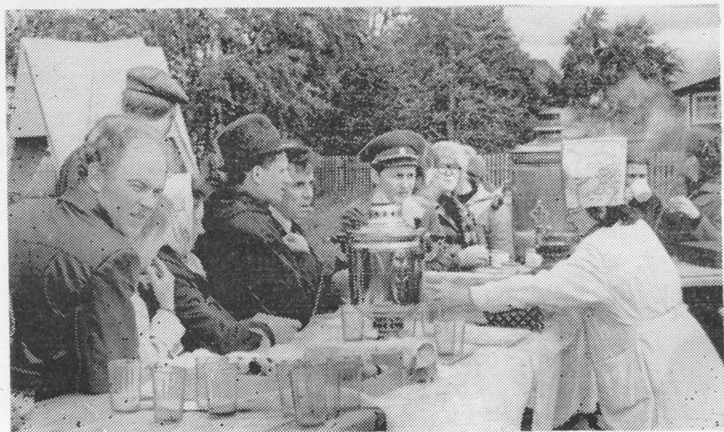
Праздничайтысьяс блинён чай юоны.