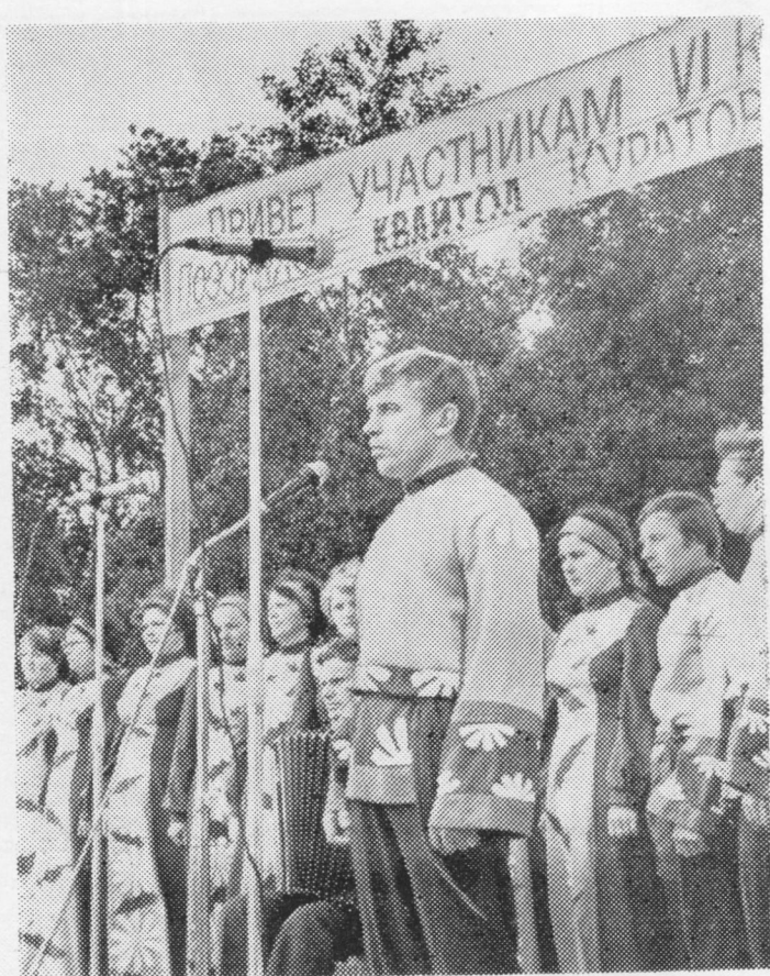
Сцена вылын — Визинса культура керкаысь «Катшасинъяс» ансамбль.