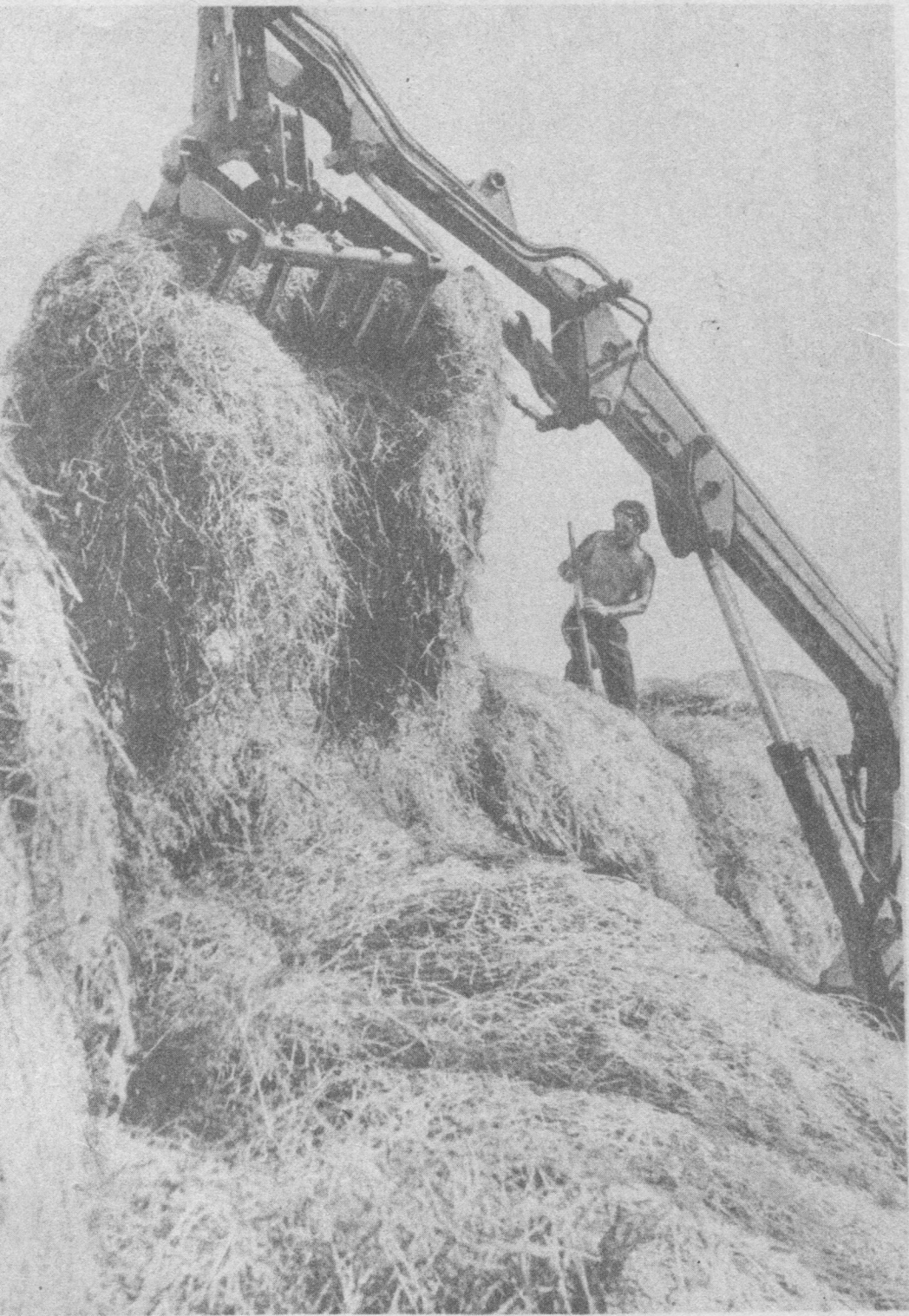
Вильён котыртóm «Подъельскóй» совхозын машинаясóн чóвтóны турун.