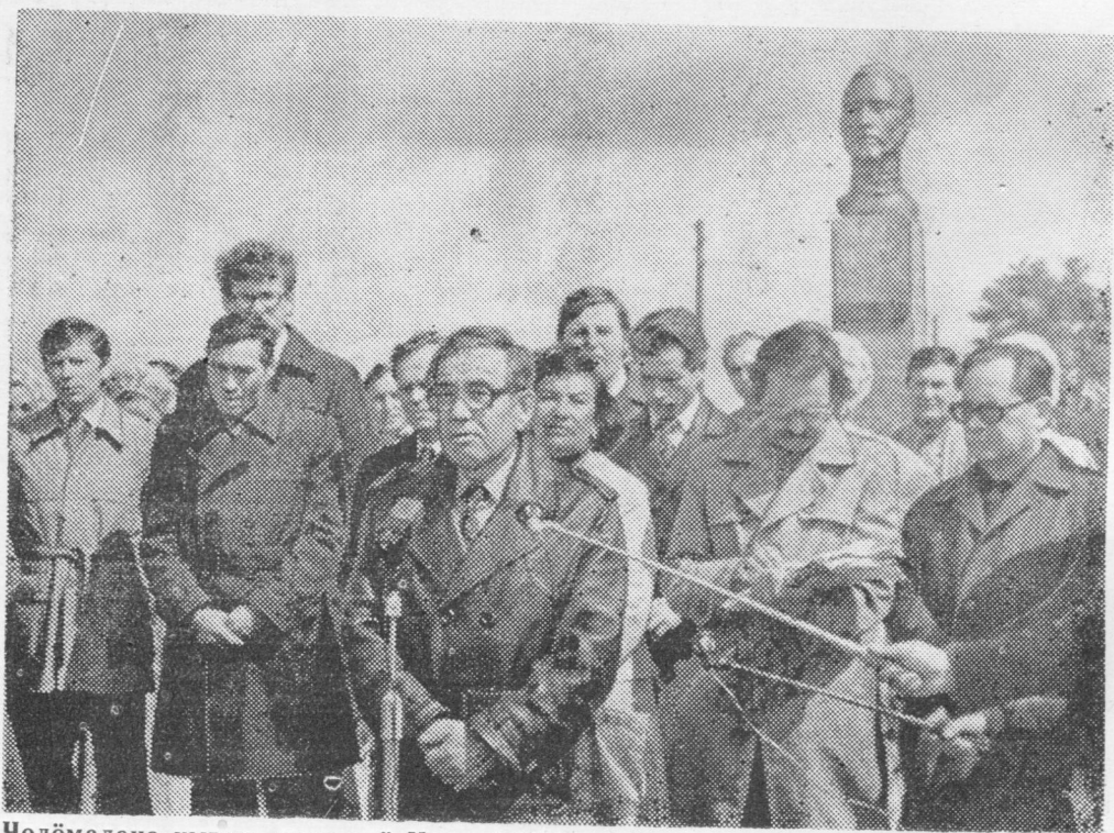
Чолӧмалана кывъяс висьталӧ Коми АССР-са писательяс союзьсь председатель Г. А. Юшков.