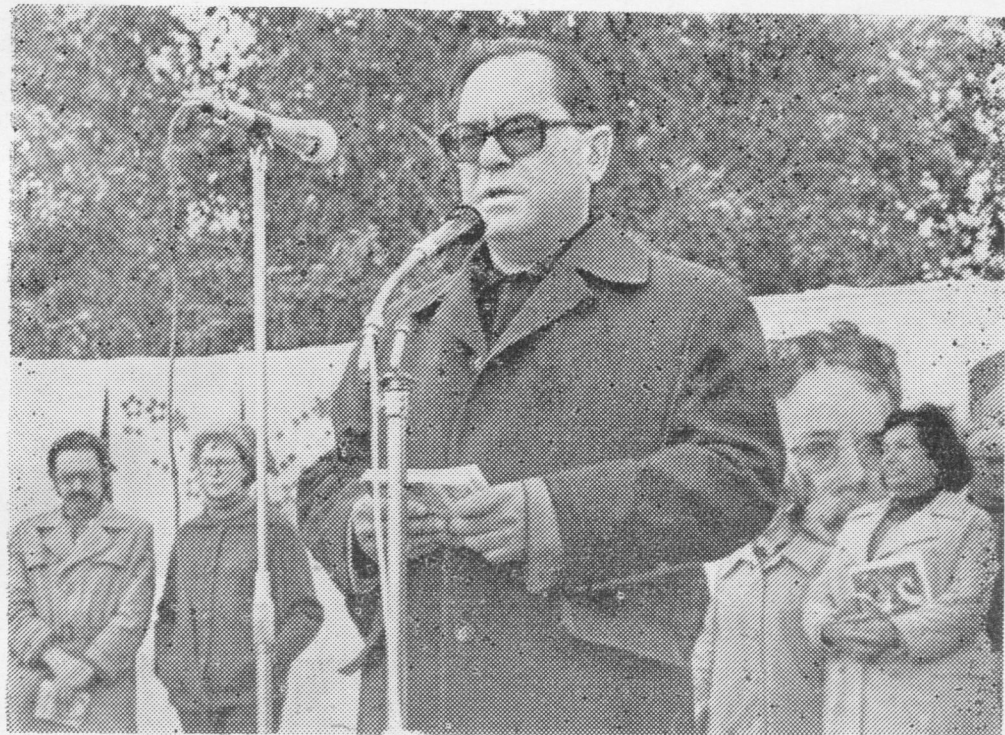
Микрофон дорын Карпат сайысь воём гёсть — украинаса поэт Юрий Шкробинец.