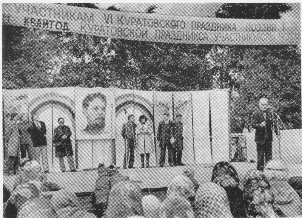
Воссис VI Куратовскӧй празник.