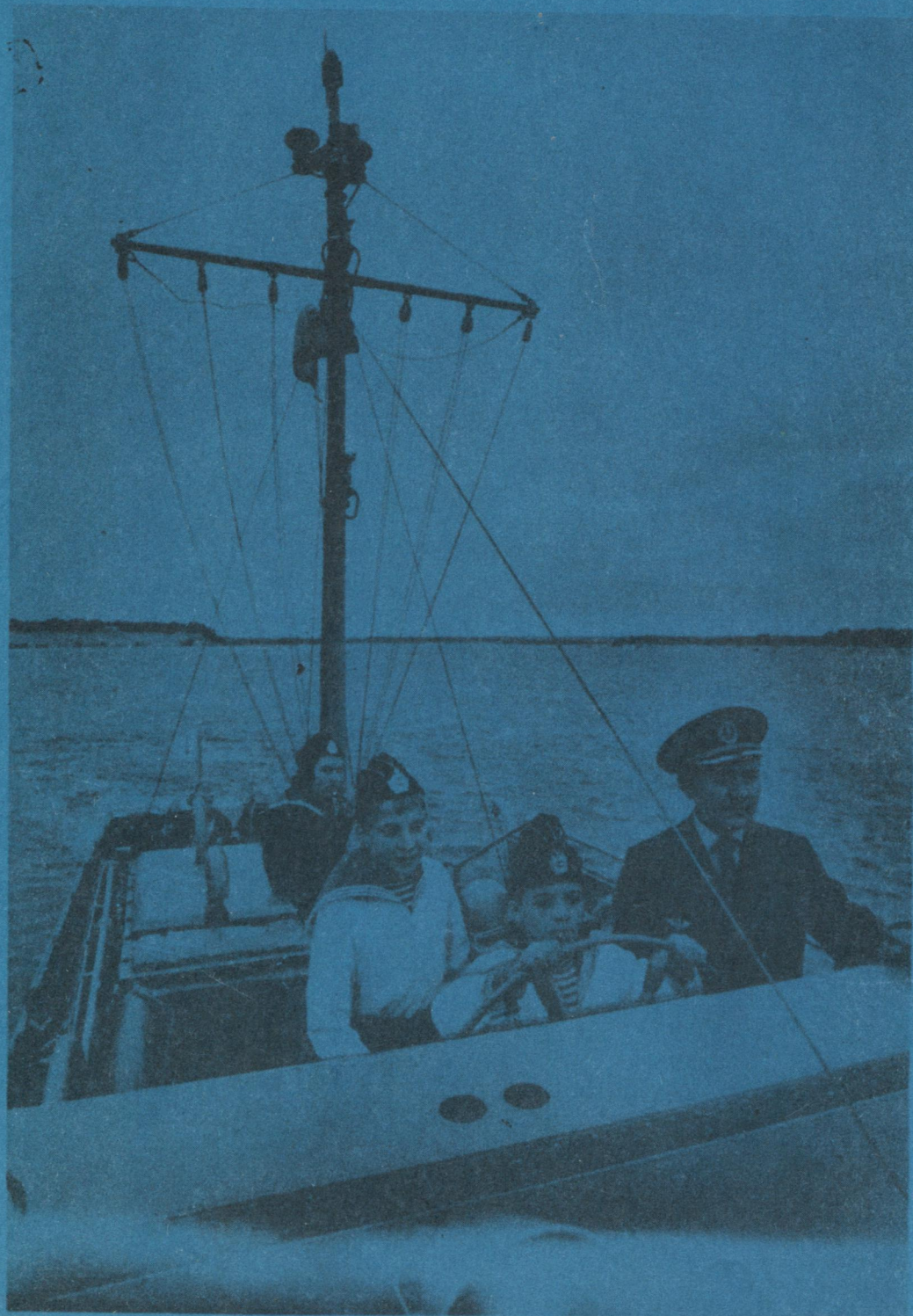
«Коми пионер» судновывса пионерскöй лагерын.