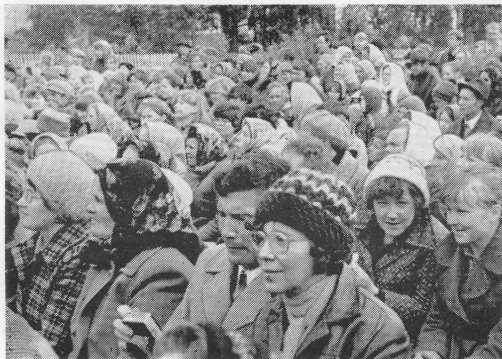
Ывла вылын тырыс йӧз.