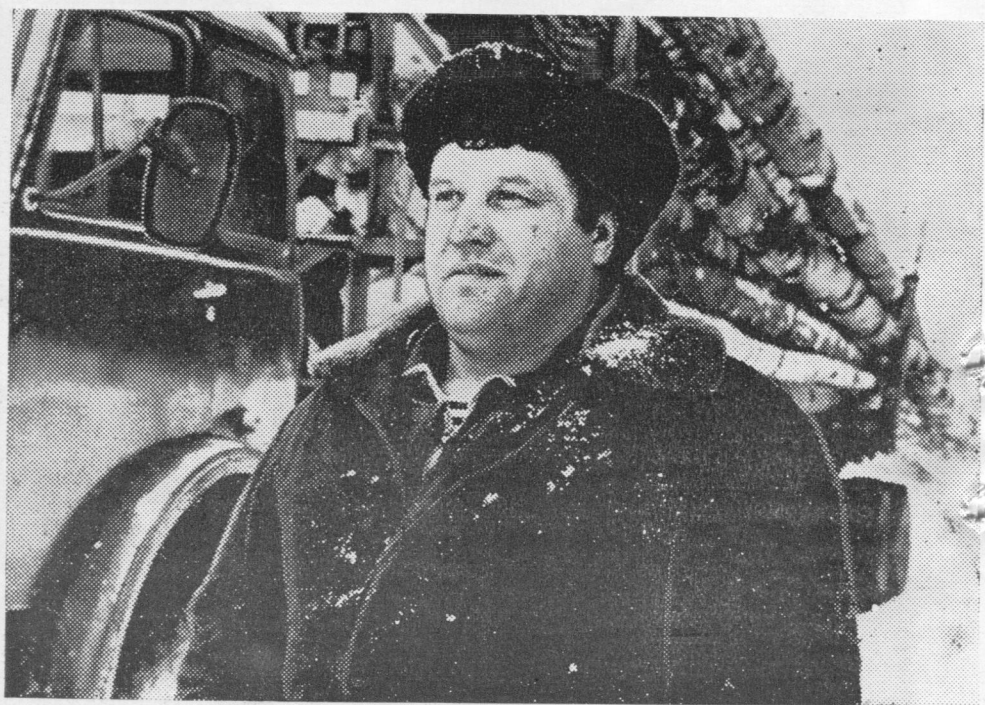
А. Н. Кабешев — рейдса медбур шофёръяссы өти, кызьод во нин сийо кыскало вөр.