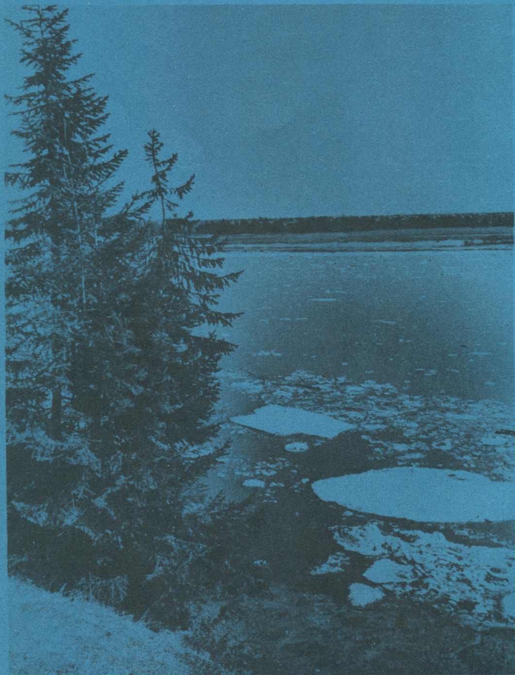
Эжва вылын тулыс.