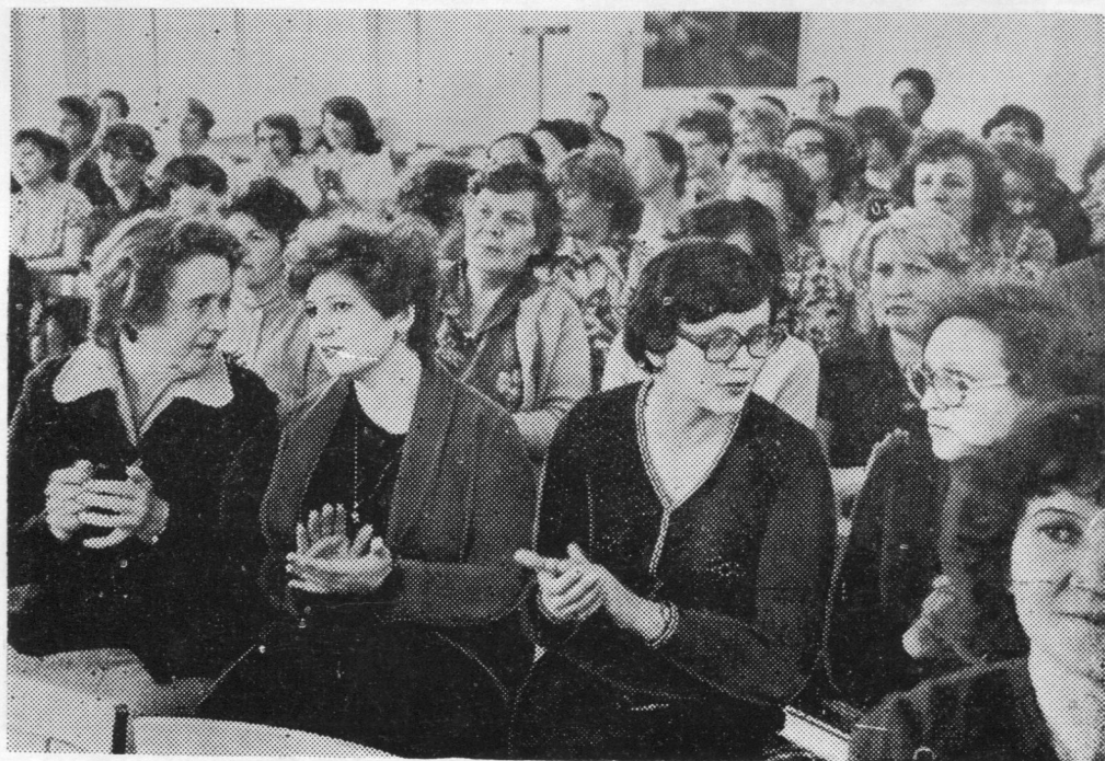
Гöстьясöс чолбамалöны «Север» мебель вöчан производственной объединениеын уджалъсьяс.