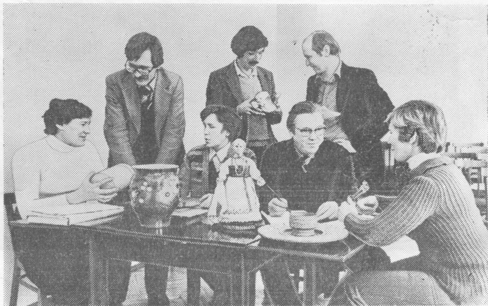
СССР-са наукаяс академиялön Коми филиалысь кыв, литература да история институтса учёнойяс донъялöны финно-угроведъяслön VI Международнöй конгресс кежлö сувениръяс.