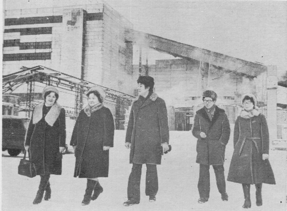
«Сыктывкарса ЛПК» производственной объединениеын уна во нин уджалб Коюшевъяслон династия.