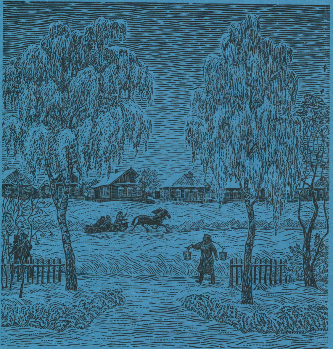
Төвсә көдзүд асыв.