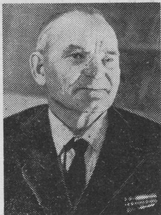
Серафим ПОПОВ, Коми АССР-са народной поэт