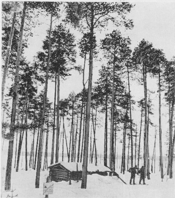
Заповедникын вöрсä шойччан керка.