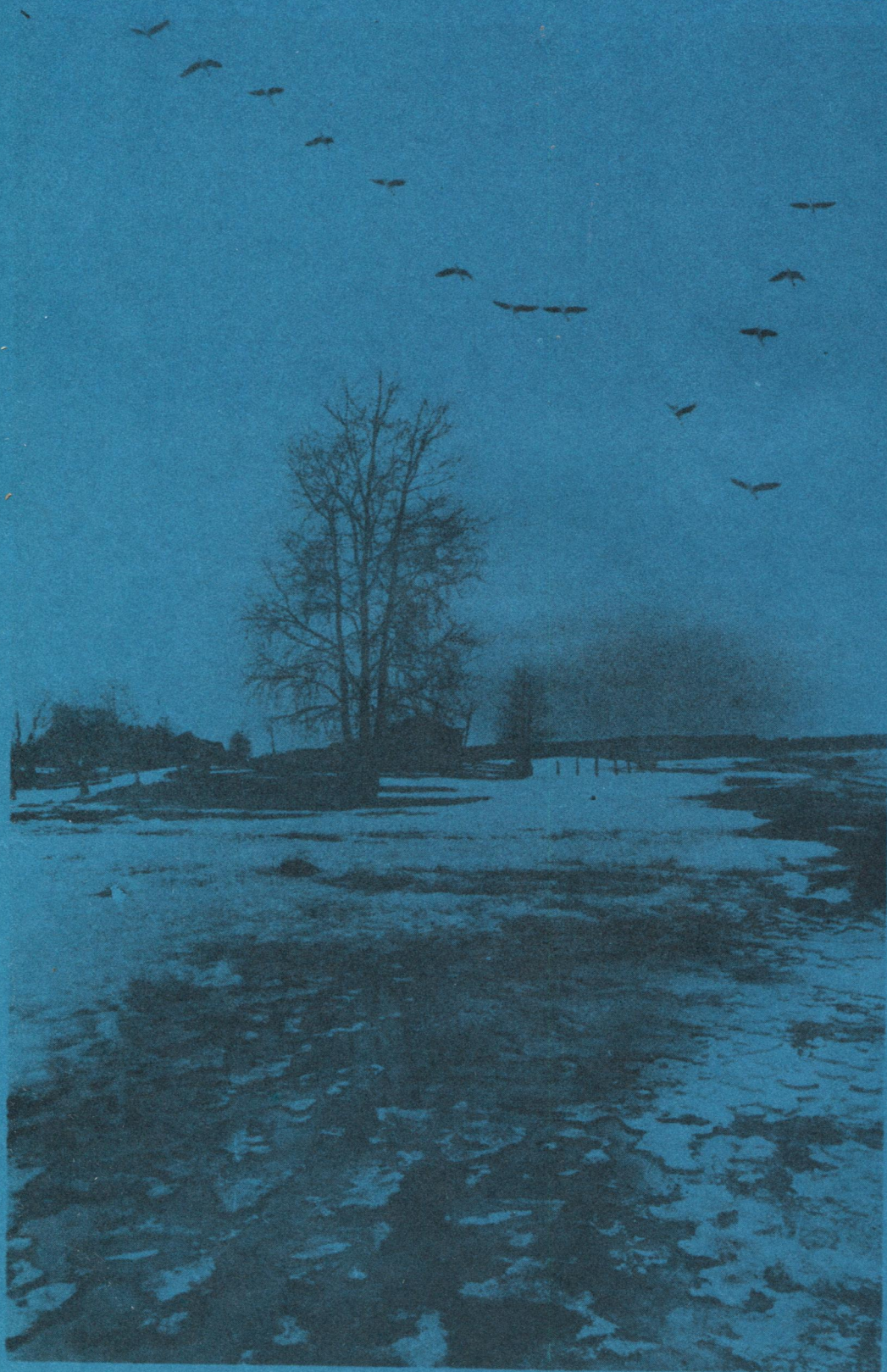
Турияс войны чужан муас.