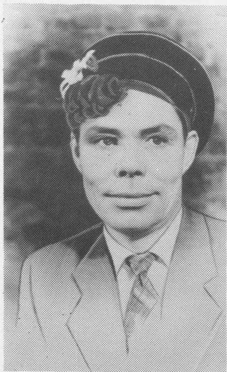
«Свадьба приданой». Николай Курочкин.