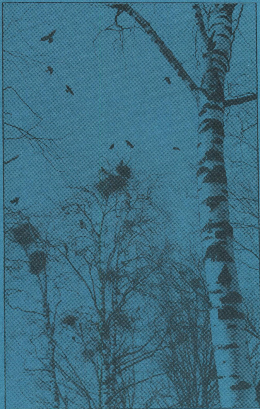
Бара воиc тулыс.