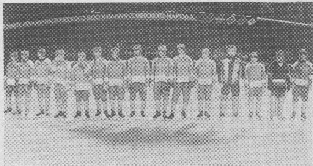
Мача хоккейон том йозлөн Мирса X чемпионат вылын вермысьяс — СССР-са сборной.