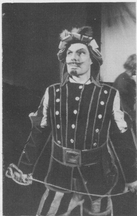
«Мамаша Кураж и ее дети». Ризенкрафт.