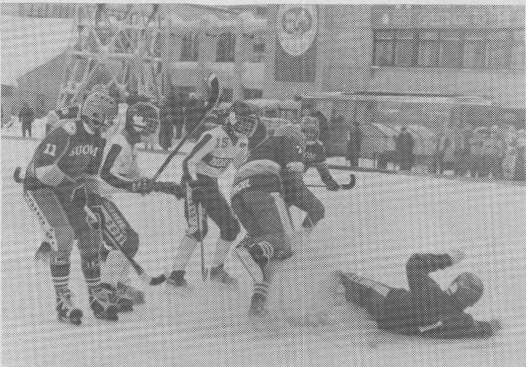
Сыктывкарса «Труд» ДСО-лөн стадион вылын мача хоккейон ворсоны финской да советской командаяс.