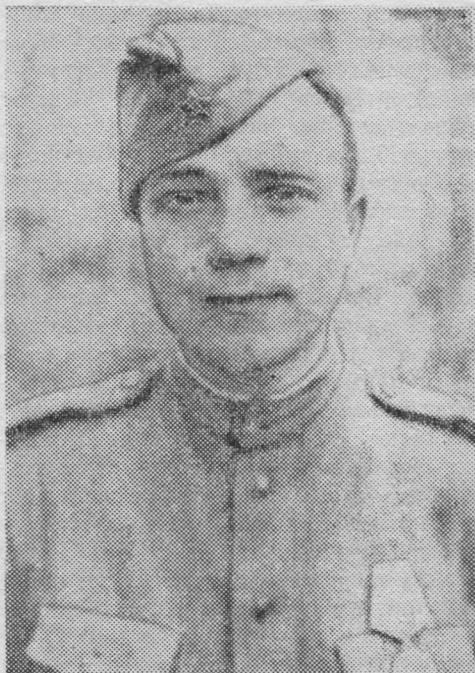
Псков кар. Офицеръясө велөдан курсъяс вылын. 1943 во.

К. А. Мерецков военнэй мемуаръясас гижө 2 ударнэй армиялөн трагедия йылысь. Сийөс вузалис предатель, изминник генерал Власов, добровольнө вуджис немецкэй фашистъяладорө. Вот сэки, 1942 вося июнь төлысь пома-сигөн, 2 ударнэй армиясө немецъяс кытшө босьтисны Мясной Борын. Кытшө веськалөм воинскэй частъяслөн