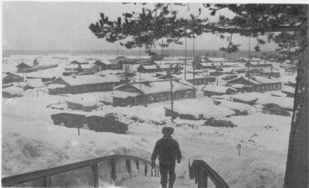
Ягкөдж. Тані олөны вөр лэдзсысяс.