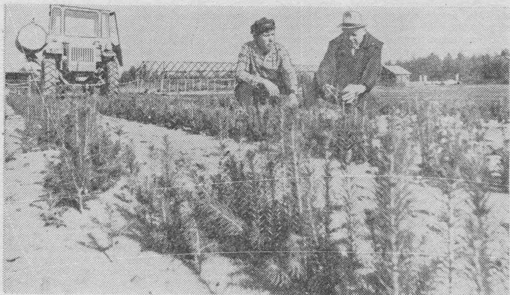
Сыольскöй мехлесхозын быдтöны вөр.

Сийö дыркөд думайтис да вочавидзис: — Вот мыжа — эг лыддыв. Кымын койдысысь кымын петас вöлi, мыйта косьмас, уна-ö быдмис. Öг тöд. Сöмын