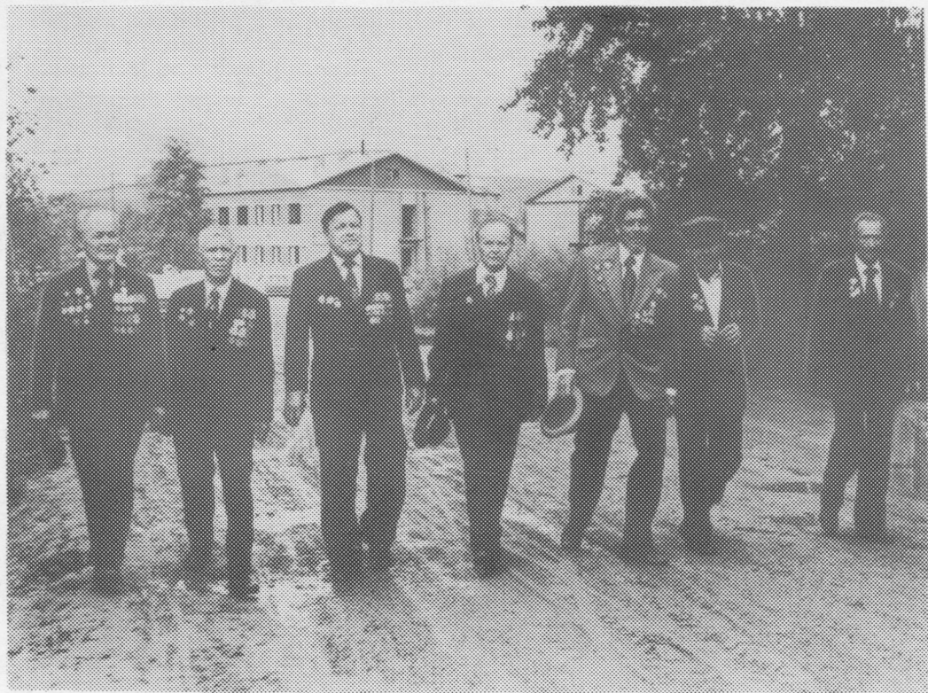
Великѳй Отчественнѳй войнаса да уджыввса ветеранъяс.