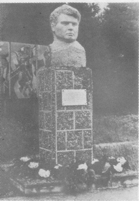
Сѳветскѳй Союзса Герѳй А. Д. Даниловлы памятник.