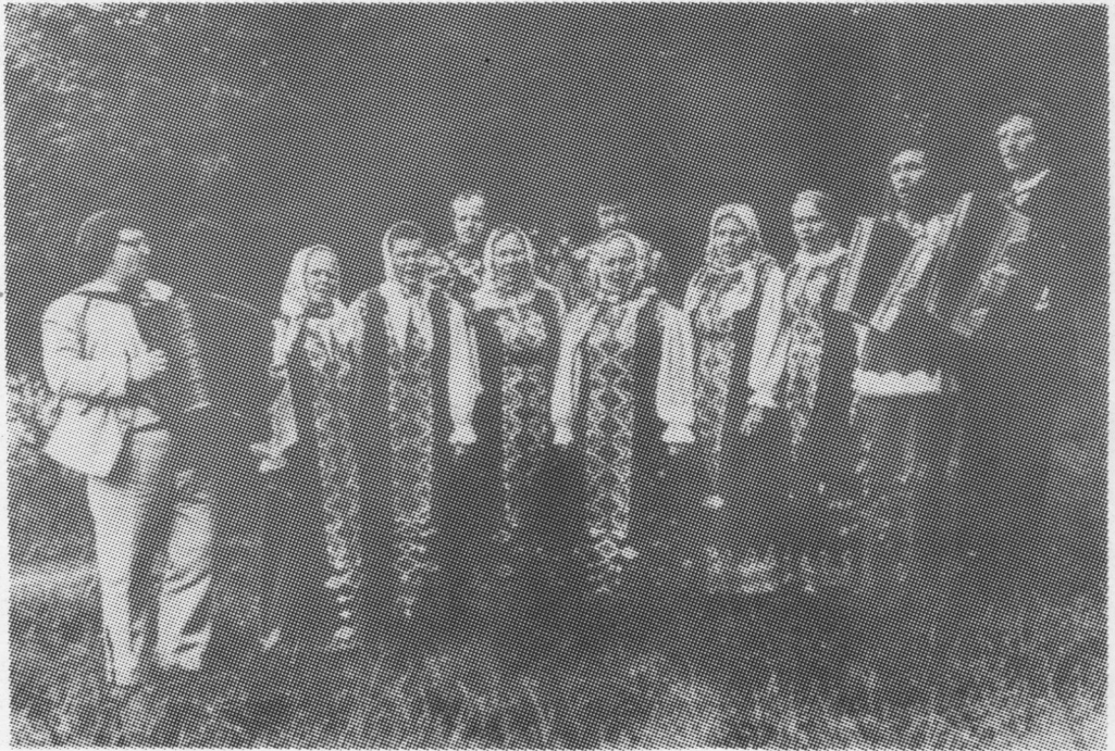
Сиктса фольклорной группасысь сьылысь-ворсысьяс.