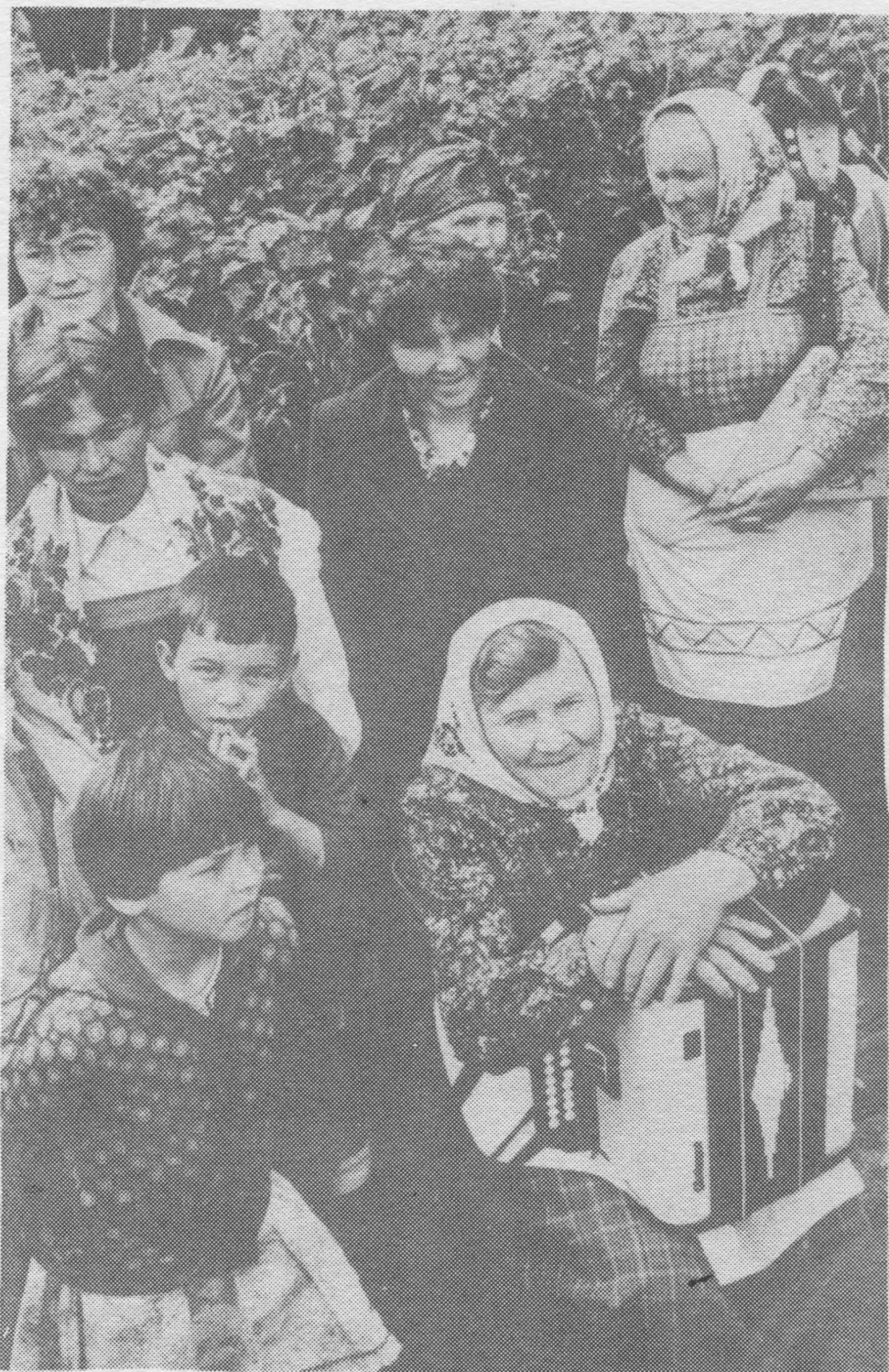
Сиктса праздник вылын.