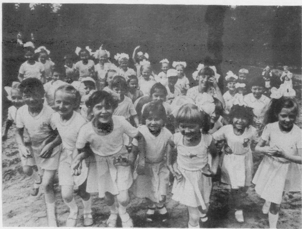
Важ сиктлӧн аския луныс.