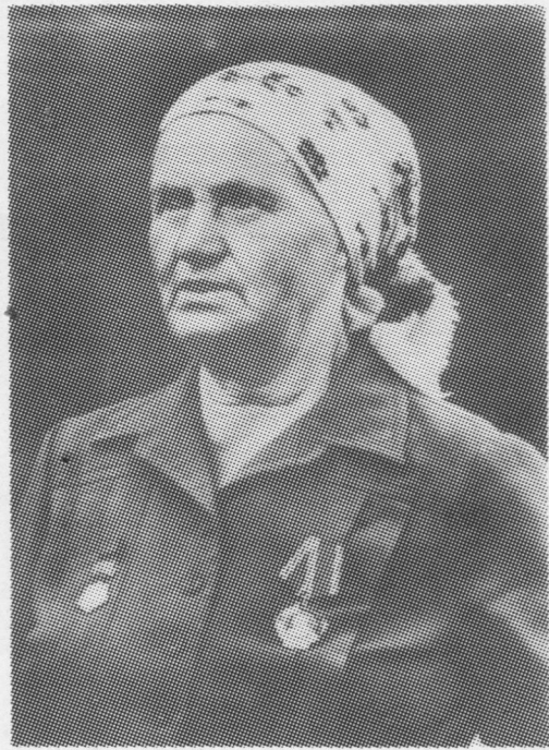
А. В. Тороповалысь бур уджсӧ пасйӧма Ленин орденӧн. Нэм чӧ- жыс сийӧ вӧр лӧдзис и видз-му вӧдитис.