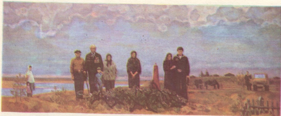
Некодџс абу вунџдџма. 1984 во.