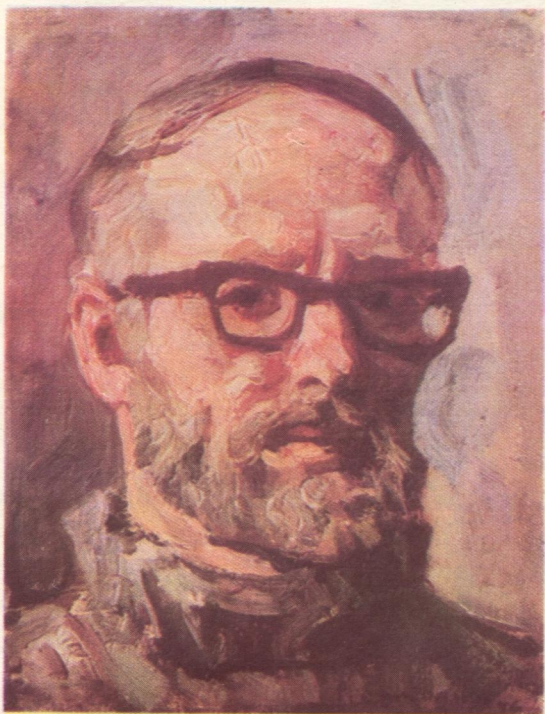
Рем Ермолин. Автопортрет. 1976 во.