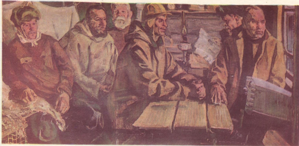
Кор Печора гыалӧ. 1973 во.