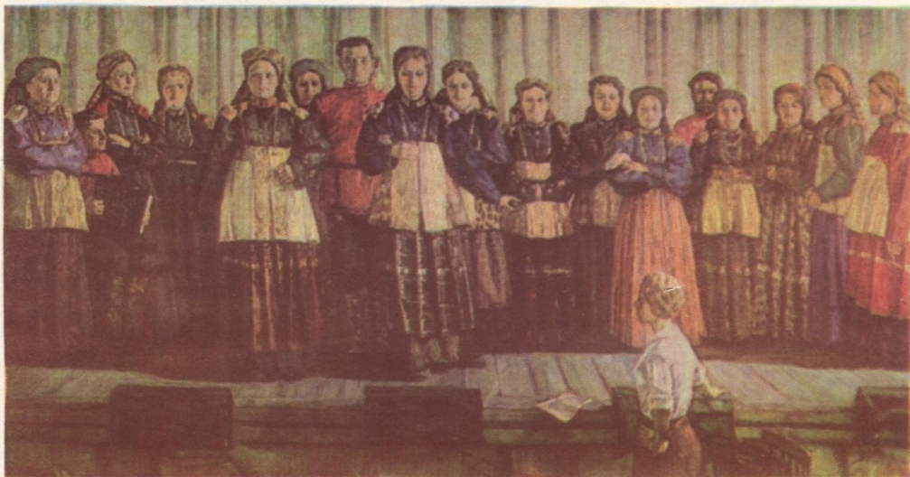
Усть-Цильмаса горка. 1974 во.