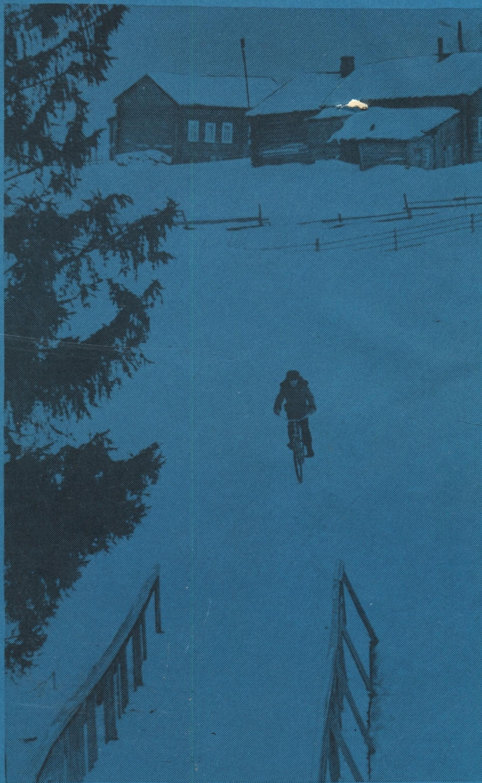
Снимокъс С. Сухоруковлѳн.