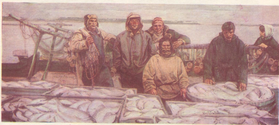
Печораса эзысь. 1969 во.