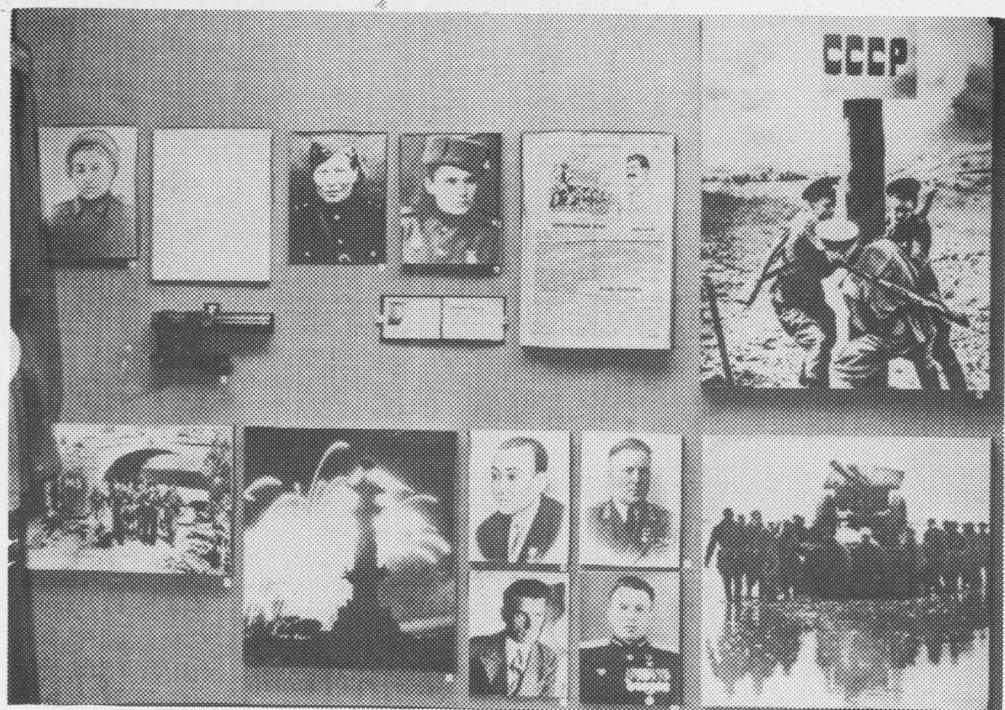
«1944 во. Сöветсоj му dziködz mezdöma nemecko-fasistskoj zaxvat-čikjäsusj» стeнд.