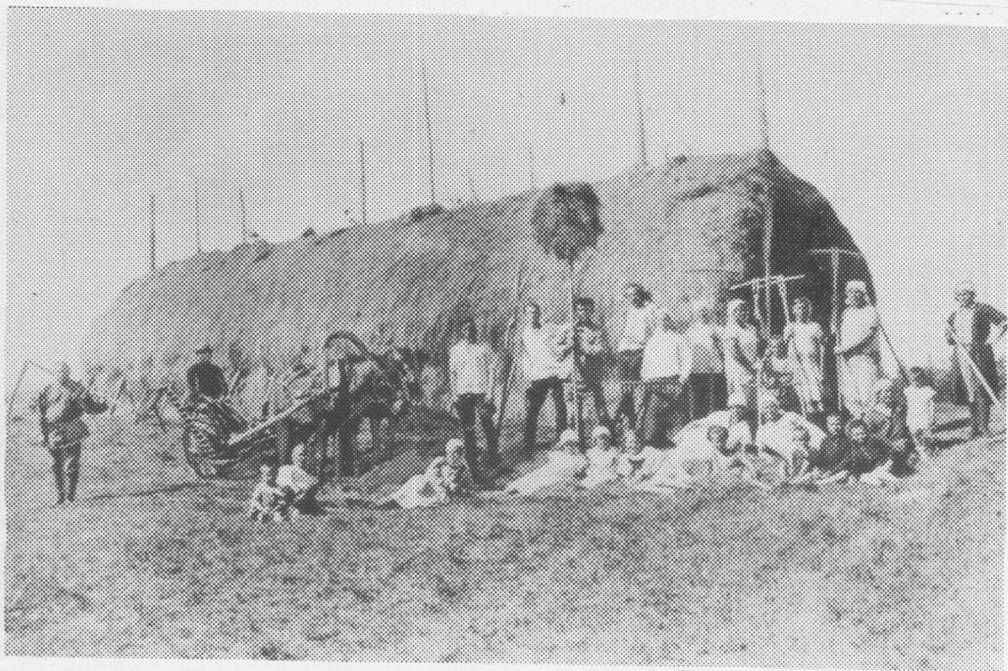
Му օтыв ыработайтсь товариществоса (ТОЗ) членъяс заптօны турун. Усть-Сысольск, 1928 во.