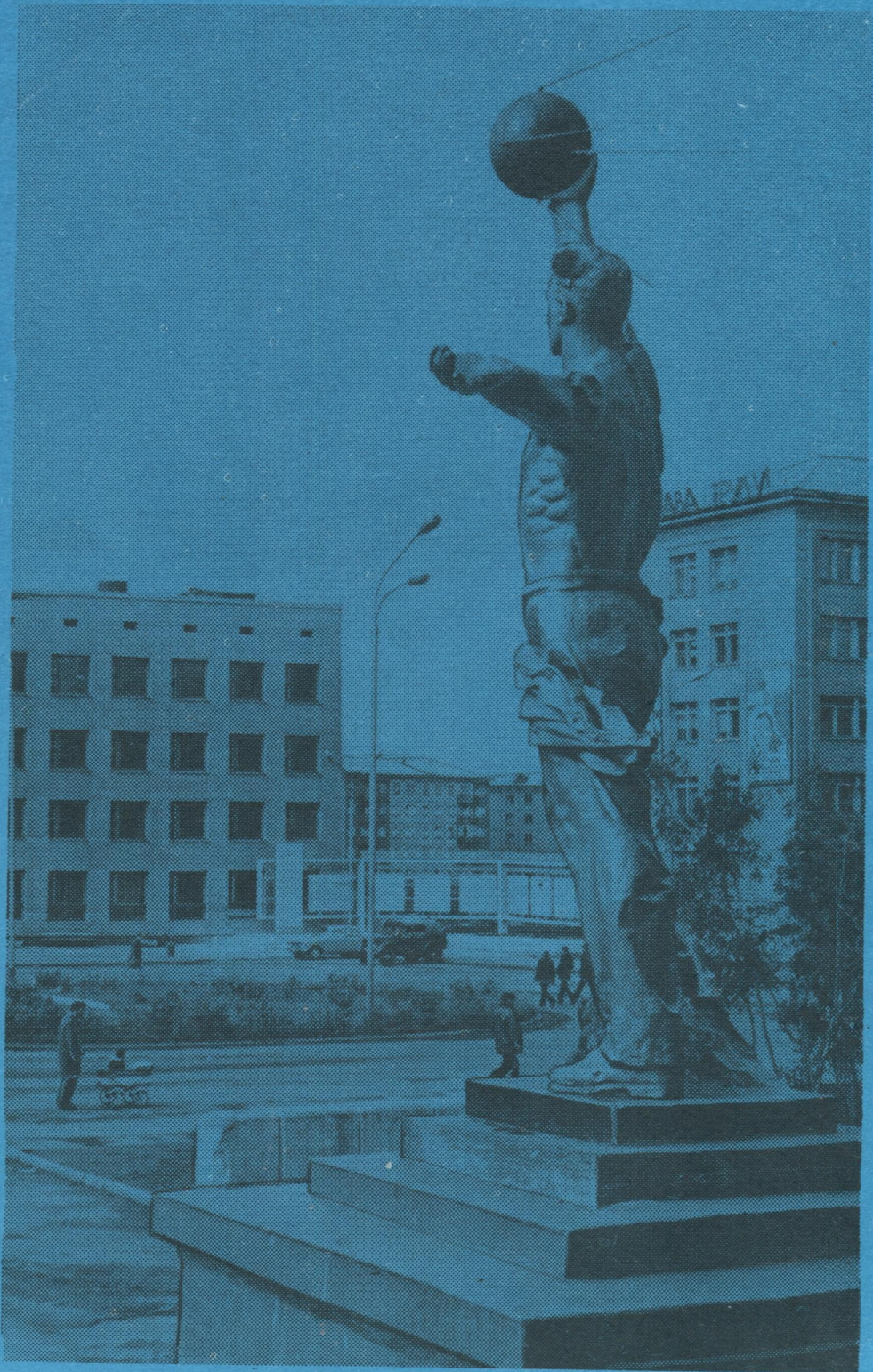
Вөркута кар. Ленин нима проспект.