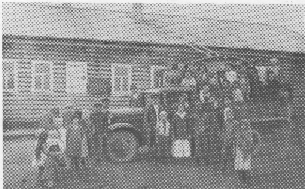
Ижемской районсь Сизябск сиктса «Трактор» колхозо воис медводдза автомашина. 1937 во.