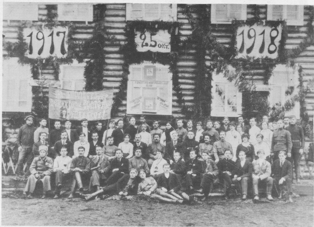
Усть-Сысольскын пасйоны Веліко́й Октябрё́скэй социалистическо́й революциялысь первой годовщина. 1918 во, ноябрь 8 лун.