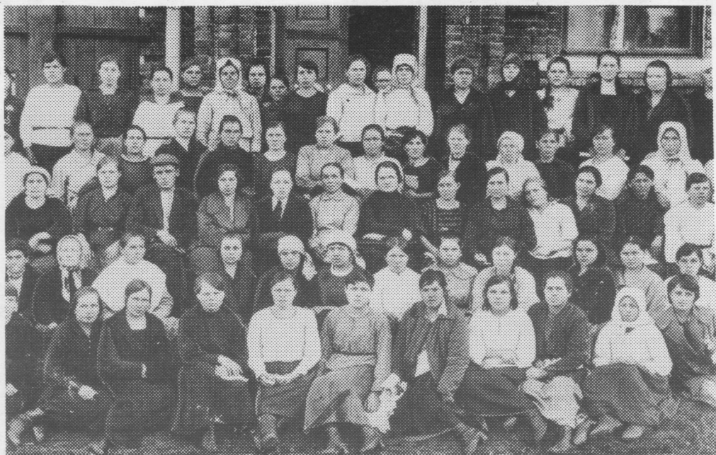
Нывбаба-крестьянкаяслӧн Коми областӧн сьездывса делегатъяс. Усть-Сыольск, 1926 вося сентябрь.