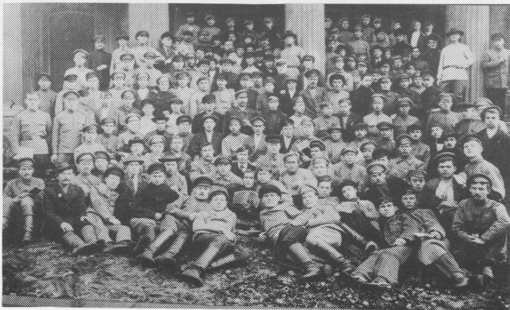
Петроградско́й рабоче-крестьянско́й университет медводзаён по-малысьяс. 1918 во. Коми крайысь 1918—1919 воясын сәні велӧдчисны кӧкъямыс морт.