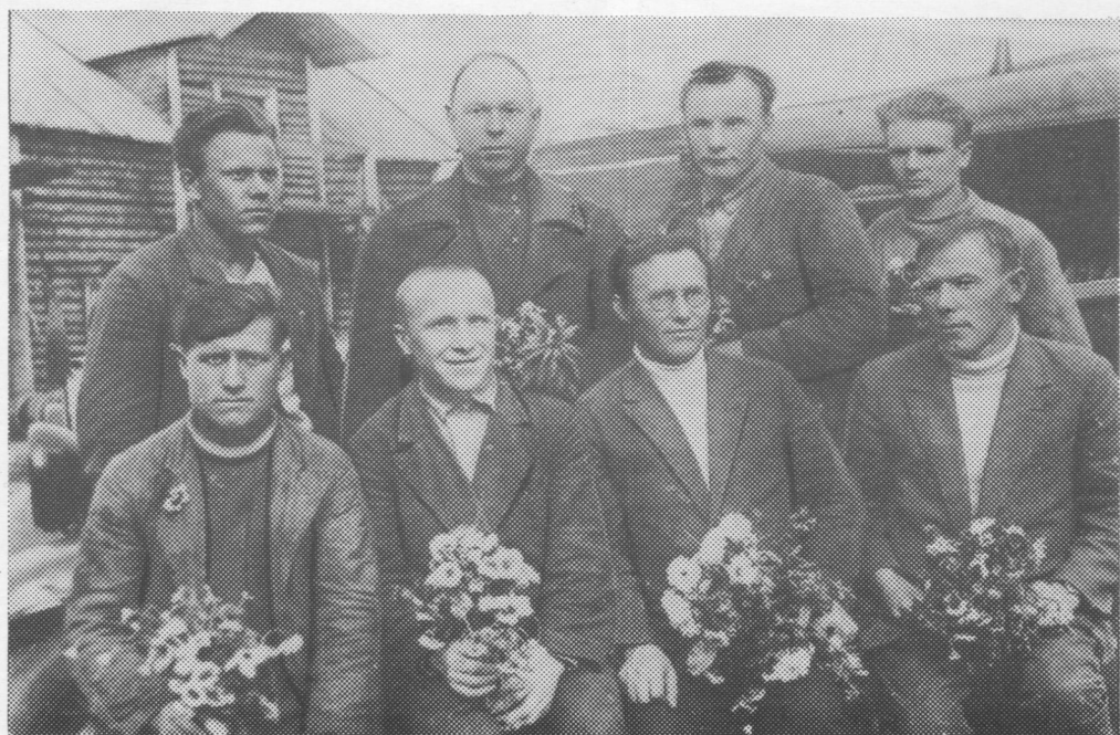
Сыктывкар—Троицко-Печорск медводдза автопробегсь участникъяс. 1935 во, сентябрь.