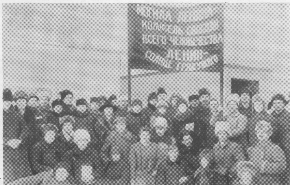
Коми областса экскурсантъяс Москваын, В. И. Ленинлӧн мавзолей дорын. 1924 вося февраль 23 лун.