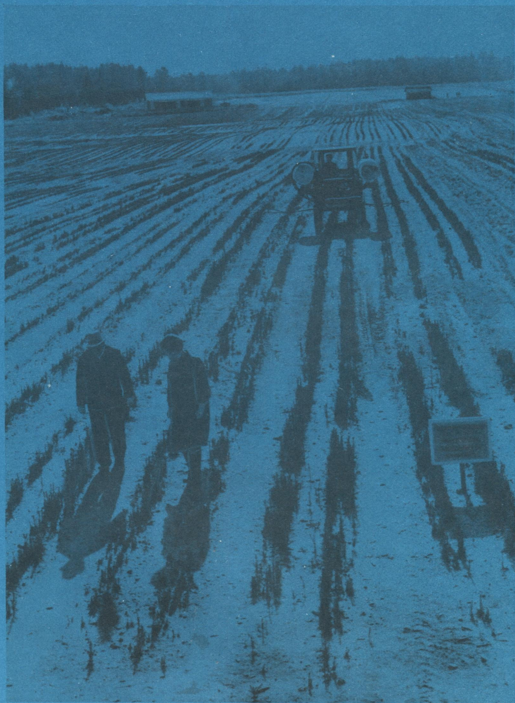
Визинга мехлесхозлӧн вӧр быдтан питомникын.