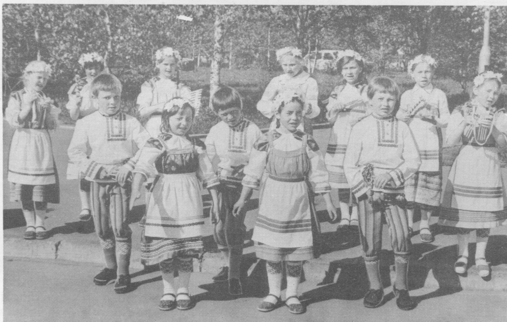
Межадор сиктысь «Қолипкайяс» сылан-йöктан котыр. 1987 вося гождом.