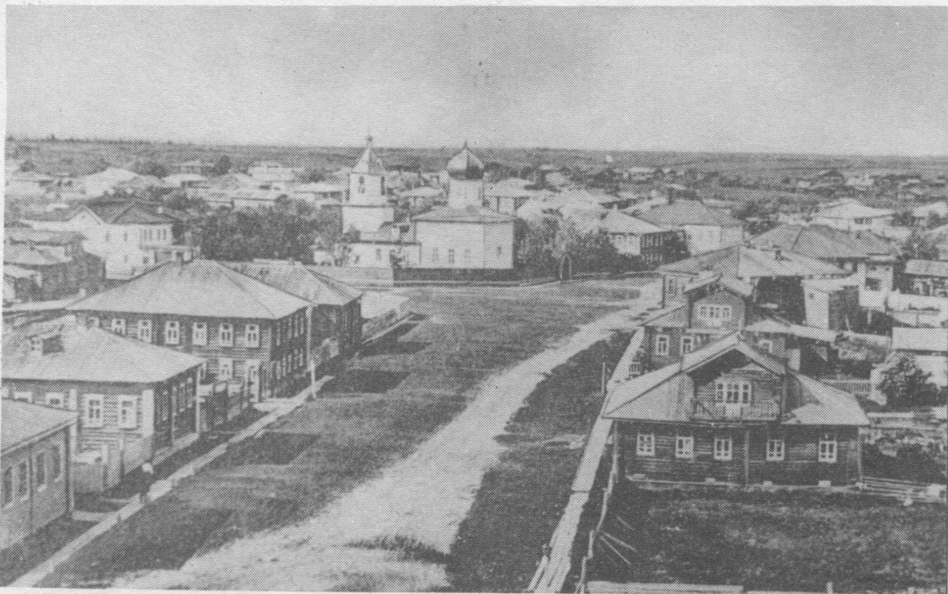
Сыктывкар (Усть-Сысольск) революцияѳдз.