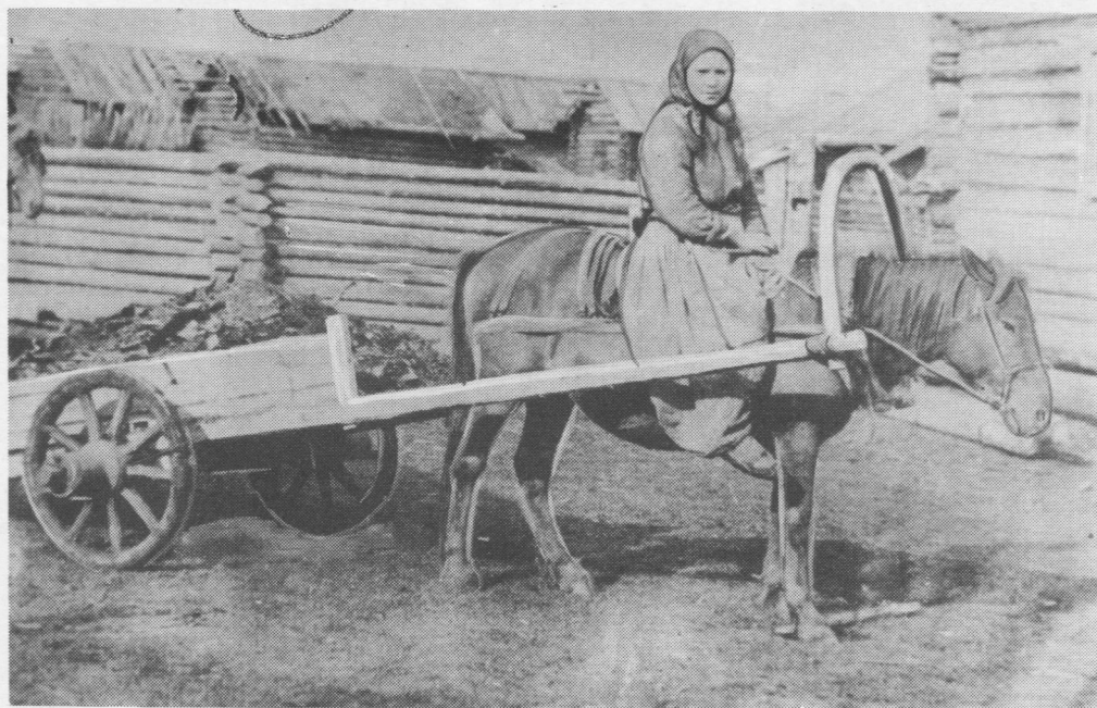
Коми сиктысь ныв. Снимокыс революцияӧдзса.