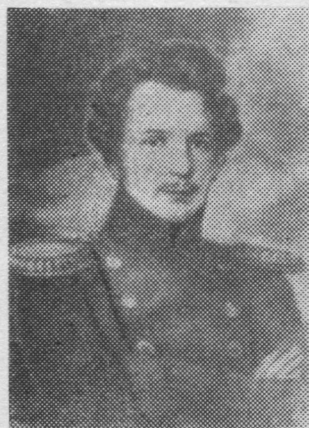
Рисуйтис Т. А. Неффе 1834 воын.

Портретьяслысь фотокопиясō ме ысталї миян странага уна научнōй да общественнōй организациясō, СССР-са Наукаяс академиялысь история да естествознание институт пыртис найōс странага тōдчана научнōй деятельяслōн торья картотекаб. Пырисны найō и Эстонскōй ССР-са Государственнōй историческōй архивса Крузенштернъяслōн фондō. Та йылысь меным юбртис архивса дирекция.