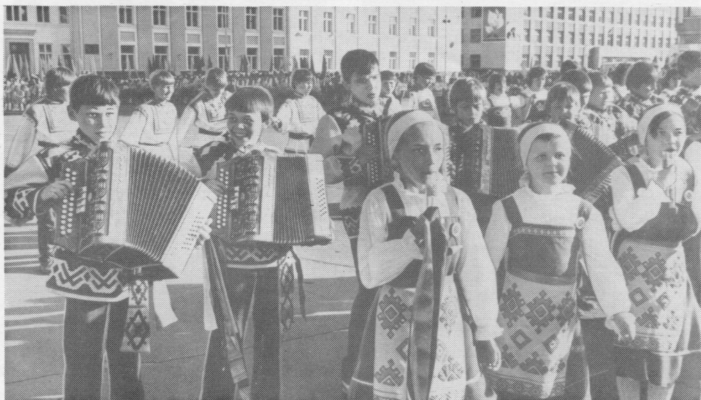
Пажгаса гудӧкасысьсяс да Усть-Цильмаса сылысь-йӧктысь челядь Сыктывкарса фестиваль вылын. 1987 вося гожӧм.