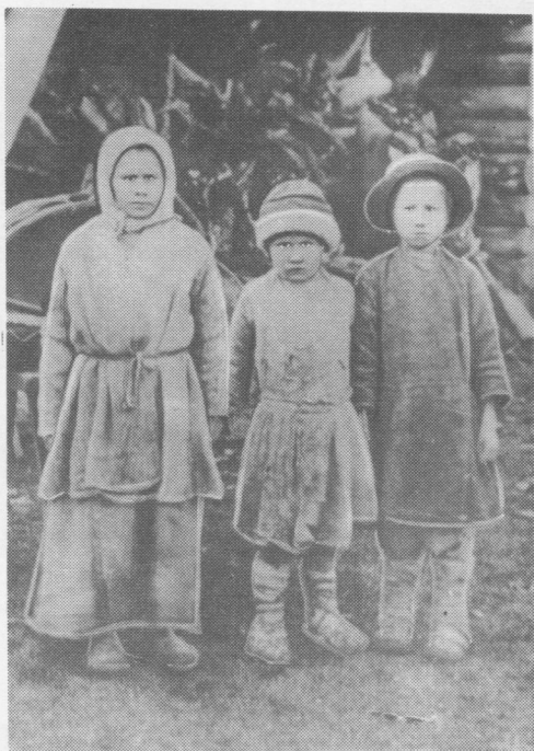
Керчомъя сиктса челядь. Снимок-ыс революцияёдзса.