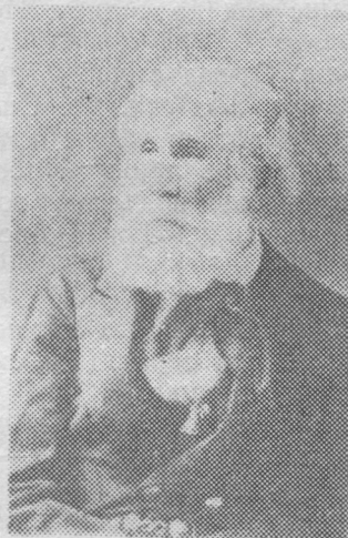
П. И. Крузенштернлōн портрет. 1881 во.

Ме гижи письмō да мōдōдї Германияса адрес кузя. Вочавидзис менам адресатлōн воча вокыс Эвэрт Крузенштерн. Письмō пытшкас пуктōма Павел Иванович портретысь вōчōм фотокопия. Портретсō рисуйтлōма Крузенштернлōн матысса суседыс Тимофей