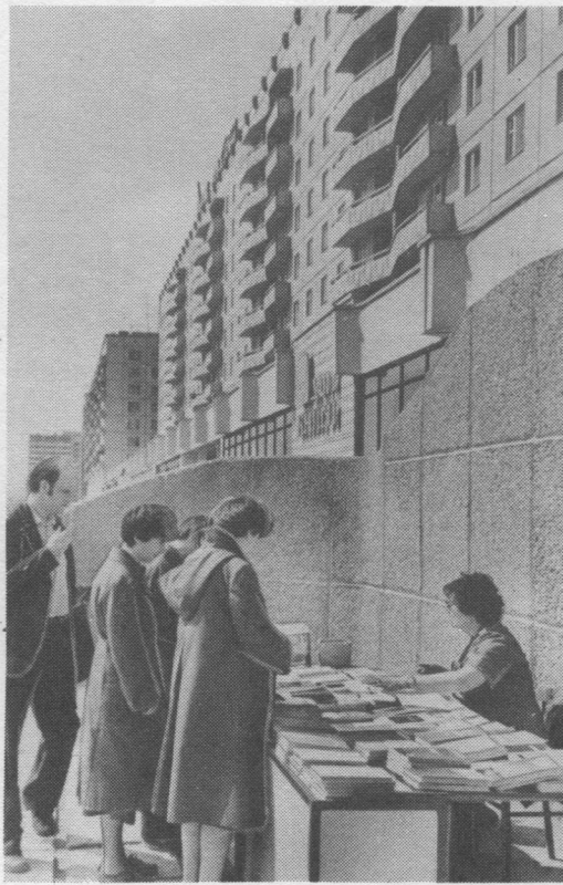
Фотокопияыс да снимокъясыс В. Вежевлѳн.