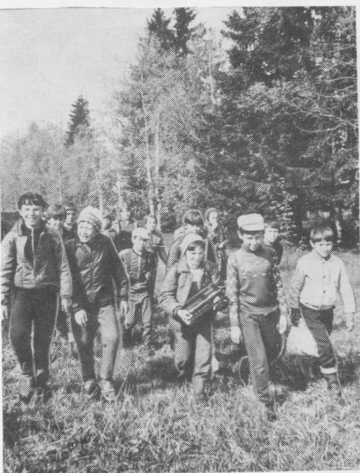
Паль сиктса шөр школаысь велёд- чысьяс походын.