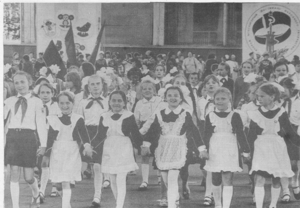
Видза олан, Гожём!..