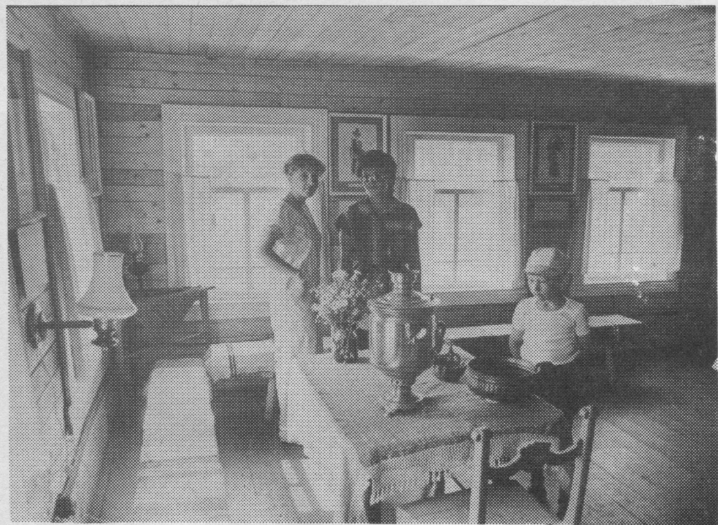
Кӧч Закарлӧн (Куратов поэзияысь персонаж) керка.