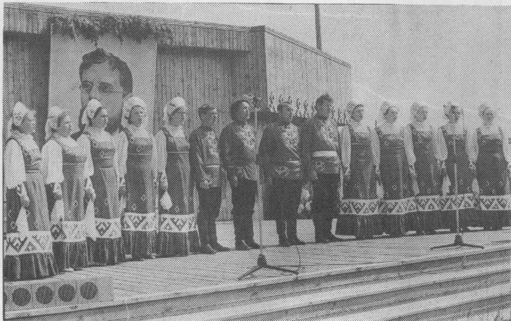
Визинса культура керкаысь сьылысьяс.