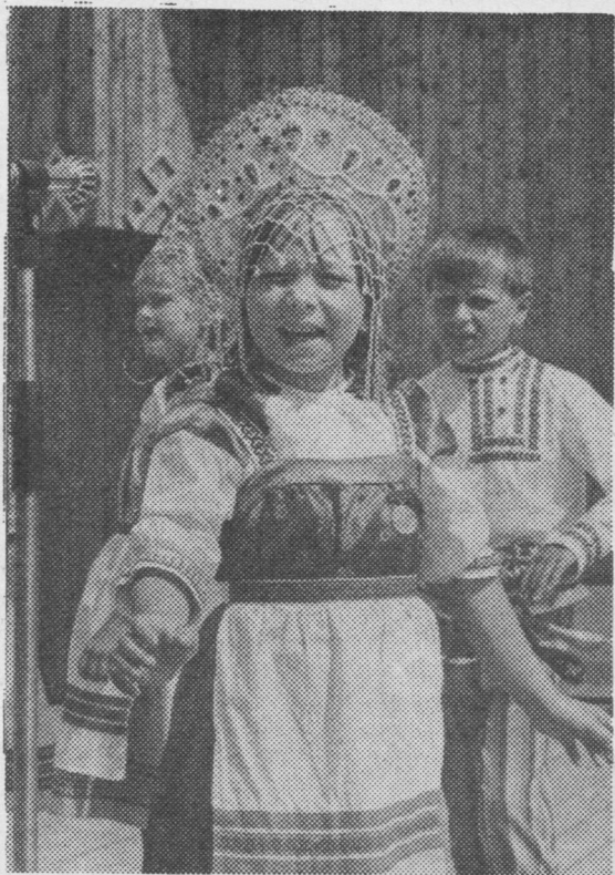
Сцена вылын Межадорса «Қолипқай».