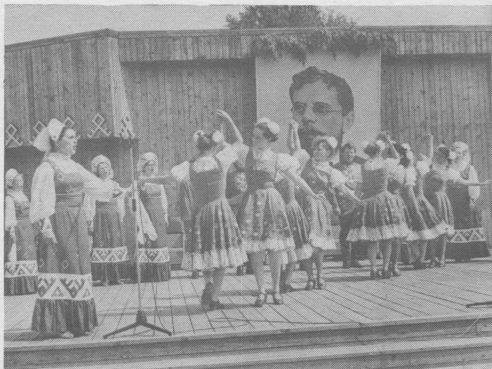
Куратовоын поэзия праздник.

Обложкаяс вылын снимокъяс В. Ячменевлөн.