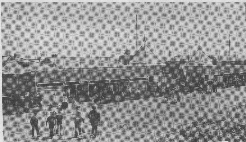
Вузасысьяс дасьтисны празник вылө воёмаяслы уна гостинеч.