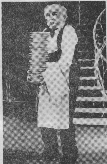
«Принцесса цирка». Ильчуков — Пеликан рольын.

вөли уна гижөма, разнөй ног доньялисны сийөс критикьяс. Но ошканаон вөли сийө, мый авторьяс видлисны лөсьөдны коми сиктын өлөм да сэтчөс йөз йылысь музыкальной произведение. И кызд тшөкыда овлө, медводдза уджыс эз прамөя артмы.