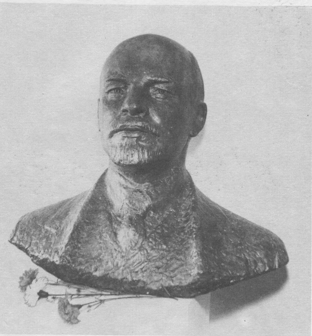
В. И. Ленинлӧн бюст.