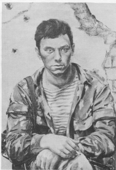
А. Золотков. «Афганец».