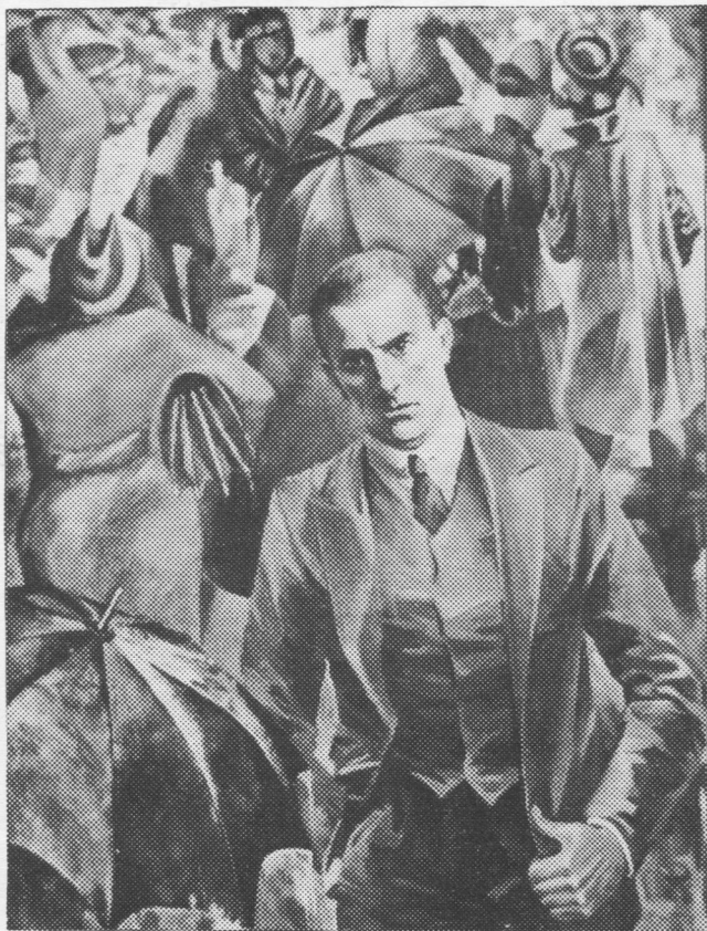
О. Кузнецов. «В. В. Маяковскийлөн портрет. 1930-өд во».