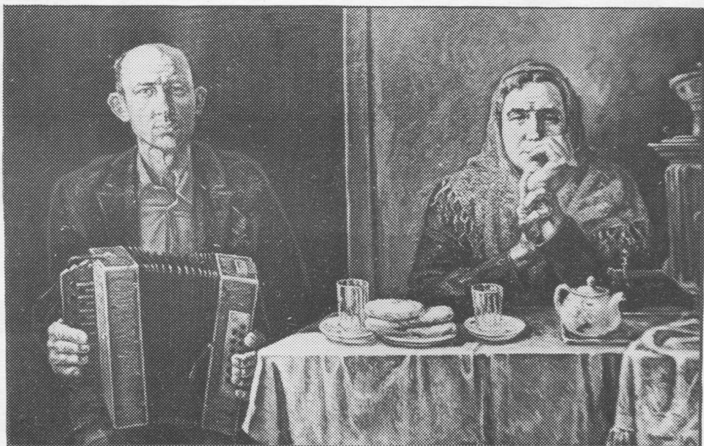
А. Копотин. «Эз лөсявны».