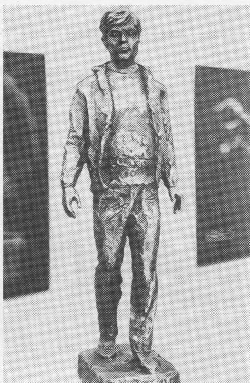
В. Безумов. «Социалистическөй Уджывса Герой болгарияса пöрдчсь К. Димитровлөн портрет».