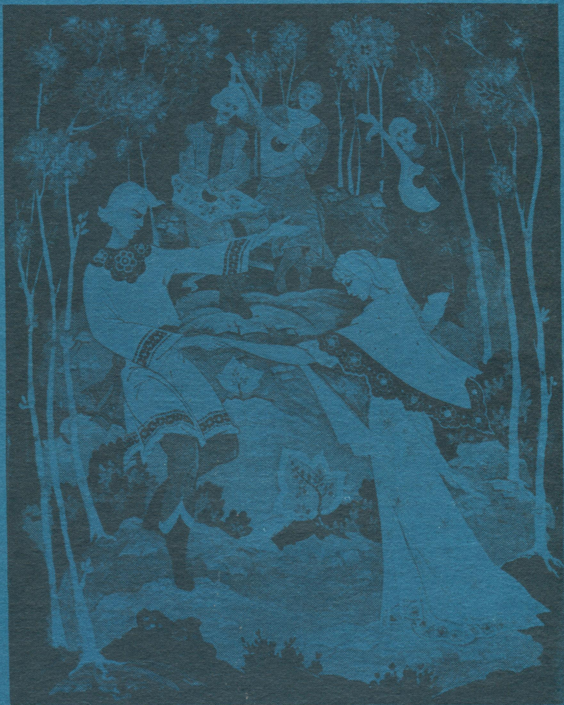
Г. Топков: «Челядьдөн С. Я. Маршақ нима республиканскöй библиотекалы паино».