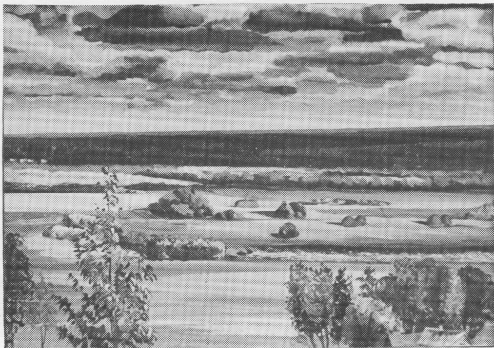
Т. Малафеева. «Эжва дорса эрдьяс».