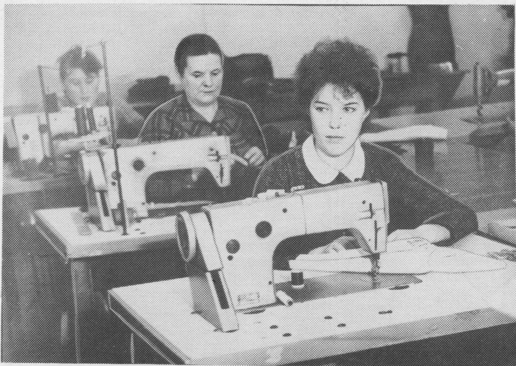
КБО-са вурсян мастерскöйын.