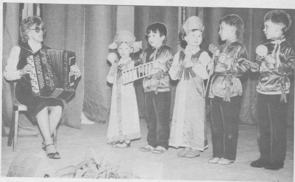
Культура керкалӧн сцена вылын — детсады челядь.