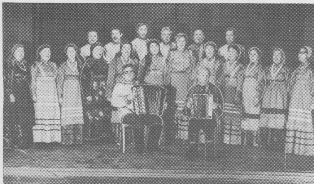
Выступайтё Мохча сиктса фольклорнõй коллектив.