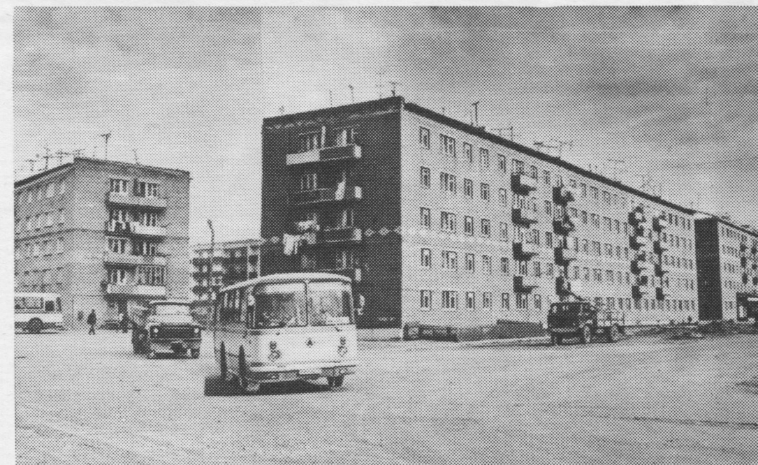
Мылдинын (Троицко-Печорскын) «Южнй» — виль микрорайон.