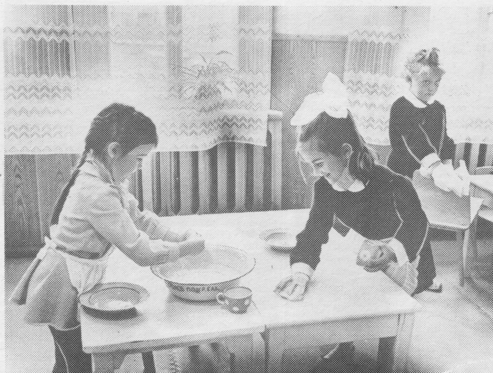
Комсомольск-на-Печоре посёлокса детсадын. Школаё дасътысьсь челядь асьныс нин идрасёны-мыськасьёны.