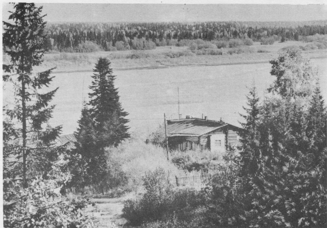
Тадзи пуксьылöма Мылдин сикт.