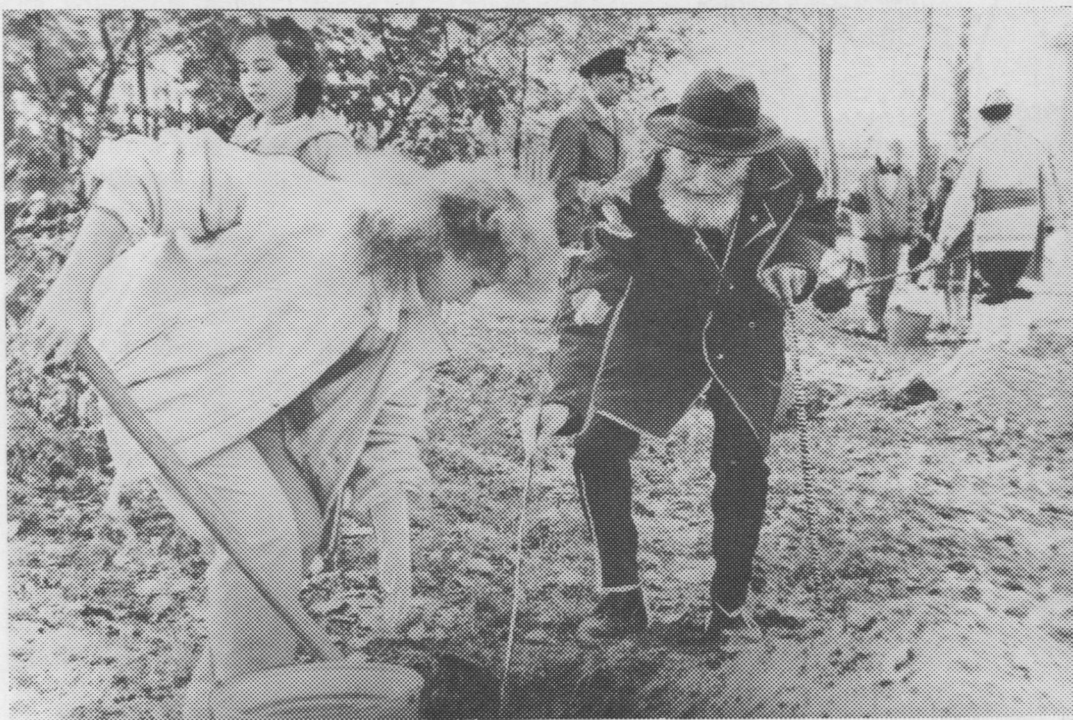
С. Г. Чавайнлөн керка-музей дорө гөстяс садитоны яблөг пуяс.