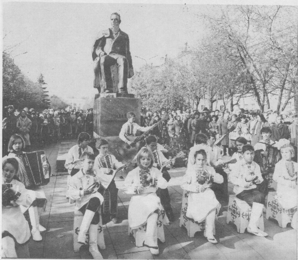
Йошкар-Олаын С. Г. Чавайнлы памятник дорын гажӧдчӧм: самодетельной коллективъяслӧн ворсӧм-йӧктӧмъяс, сьылӧмъяс.