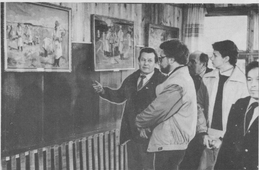
Гөстяс төдмасьоны музейөн.