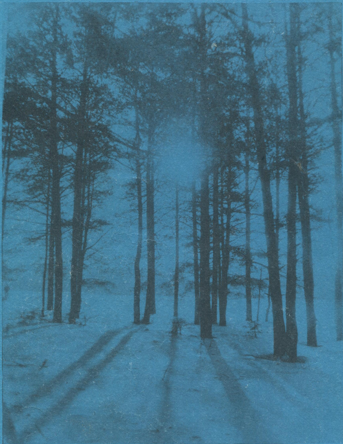
Пуяс улын — тулыс.