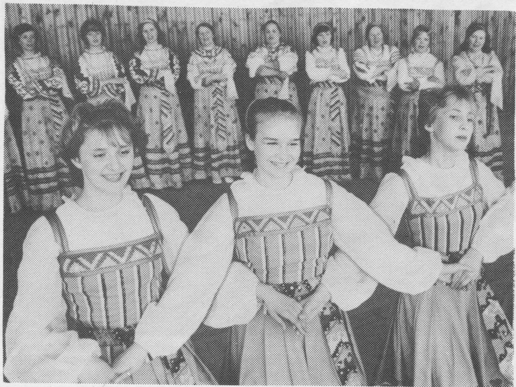
Куломдінса культура керкаысь сьылысь-йоктысьяс.