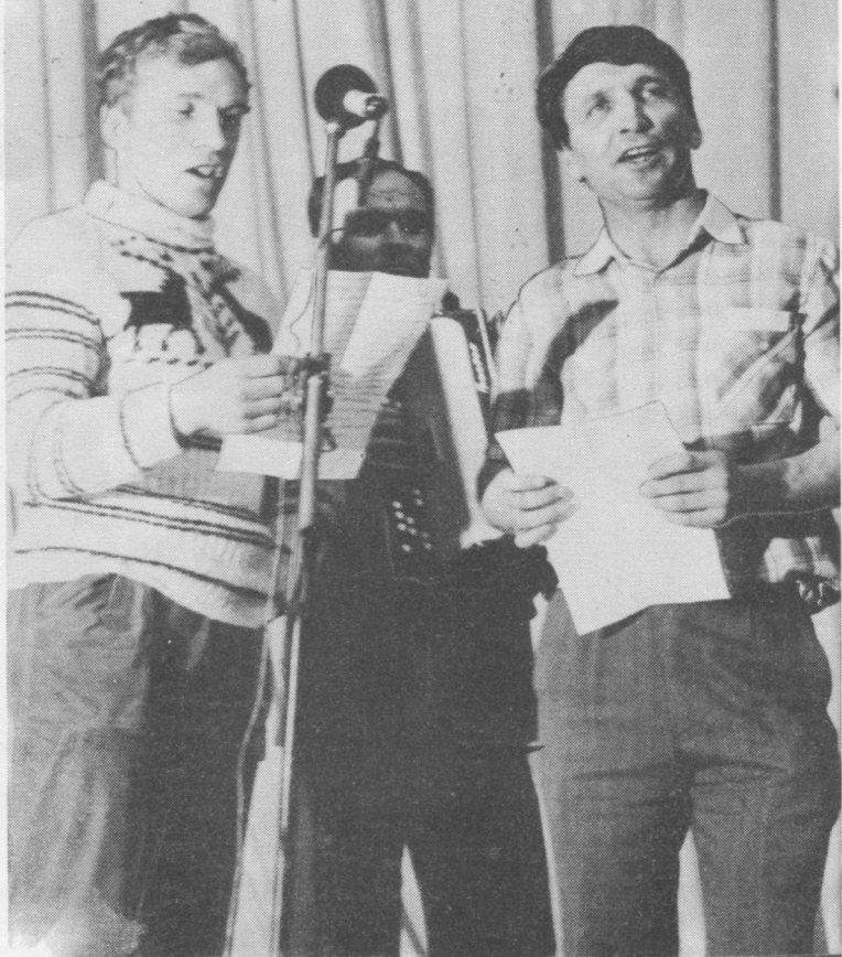
Сыктыв районысь самодеятельной артистыяс сыллоны выльон лосьбодом частушкаяс.