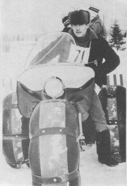
Илля-Шорысь (Емдін район) Анаголий Кучерявийлы ас вочом машинасьыс сетісны приз.