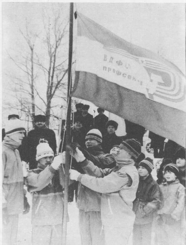
Емдін районса команда лэптö проф- союзьяслөн ВДФСО-лысь флаг.