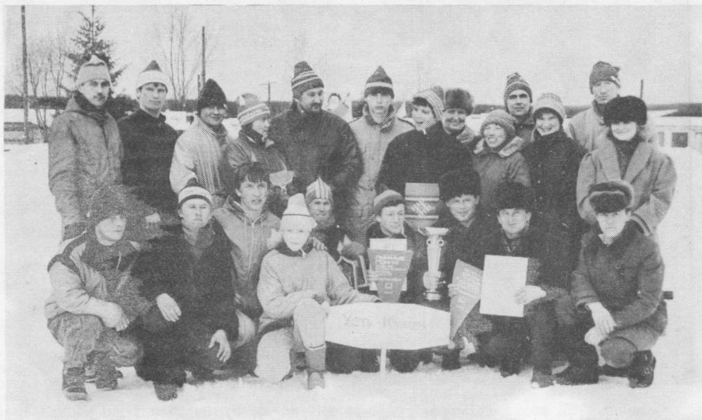
Куломдінса команда фестиваль вылын чукортис медся уна очко да босьтис кубок.