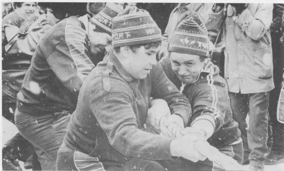
Канатон кыскасьомын медся вынаон вöліны печорасяйс.