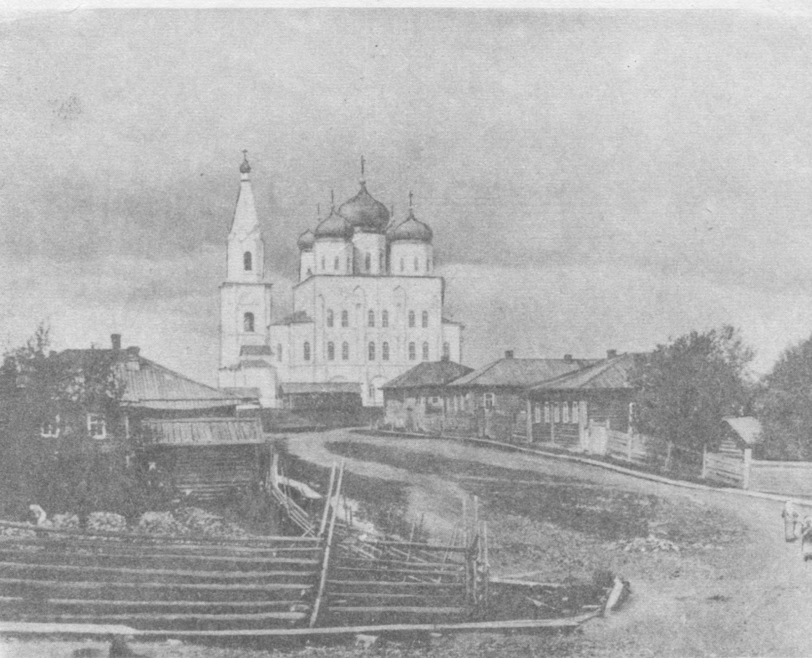
Святѡй Степанлѡн собор 50 во сулаліс Усть-Сысольск шѡрын (ѡнія Юбилейнѡй площадь вылын). Қисьтѡма сійѡс комынѡд воясѡ. Енлы эскысыя корѡны бѡр ловзѡдны тайѡ чуймѡдана мича сооружениесѡ.