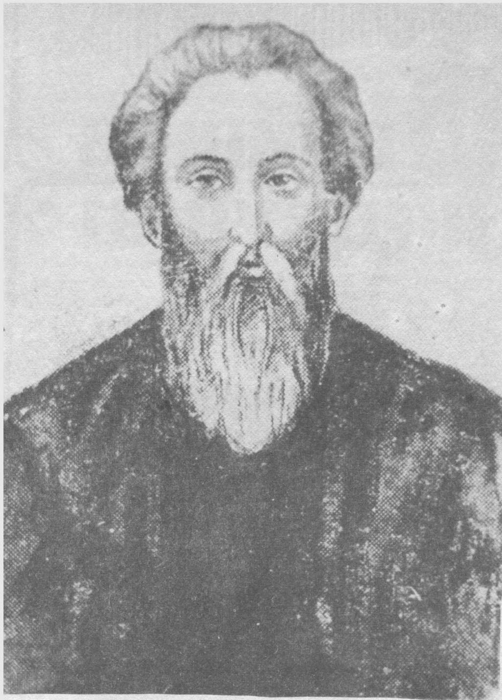
СТЕФАН ПЕРМСКОЙ. Сы йылысь гижодыс журналлӧн 47—55 лист бокъясын.