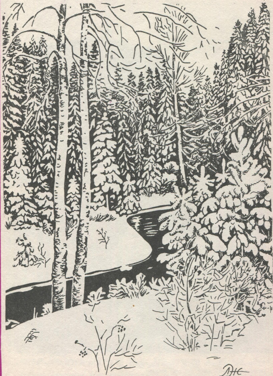
Л. Жаговалён серпас.