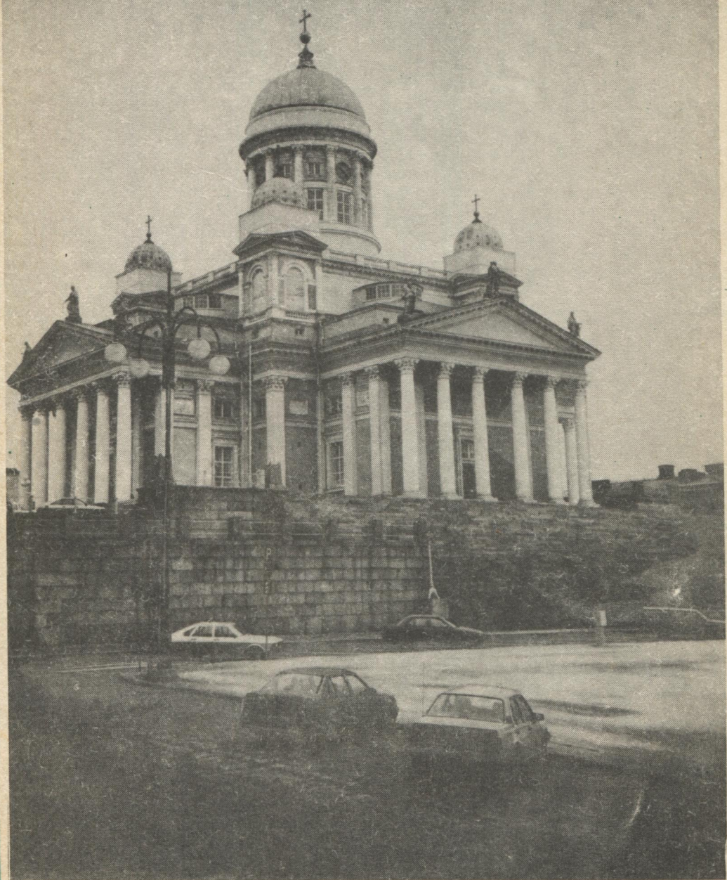
Хельсинки шөрын Вежа Николайлөн собор. Кыпөдөмаось сійөс 1830—1852 воясö.