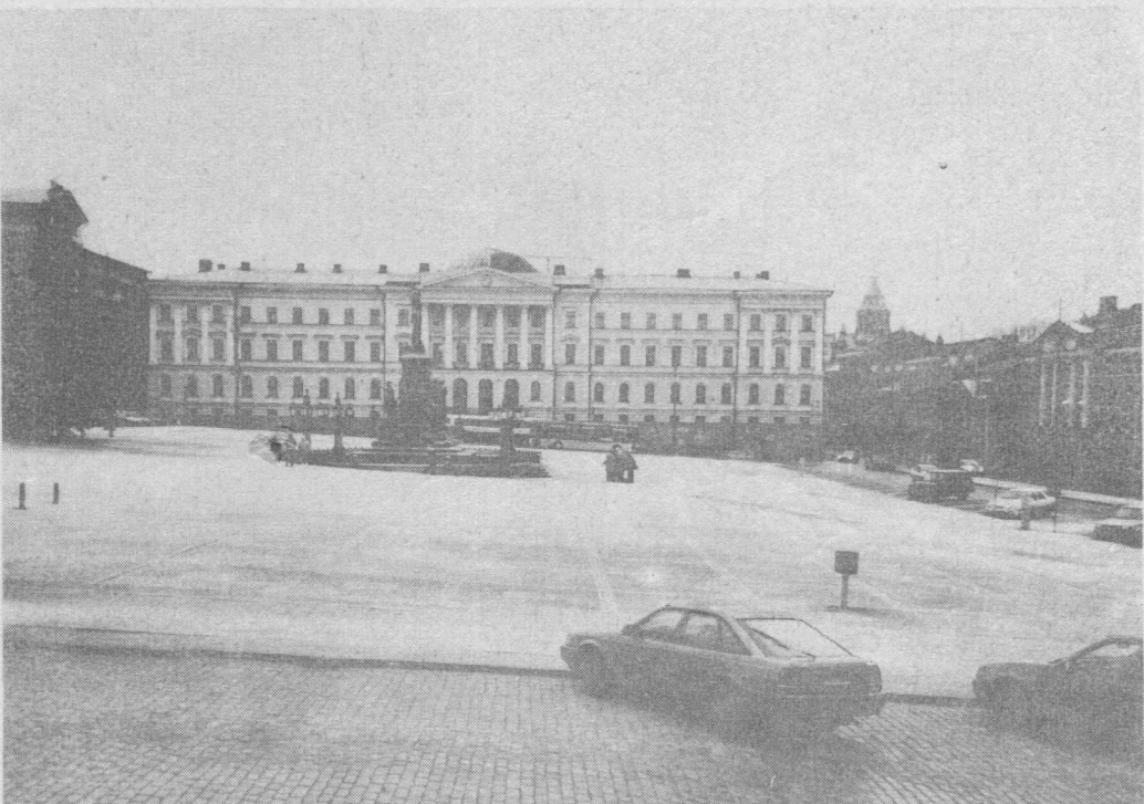
Финнъяслөн столица. Сенатводзвывса площадь, кōні век овлōны кыпыд церемонияс, чукōртчылōмъяс.