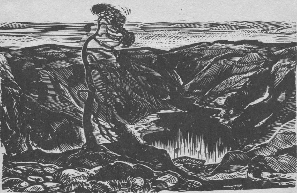
Изъя му. Рисунокс В. Краевлön.