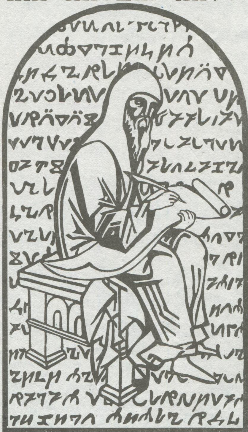
1372 – 1375 Стефан Храп лӧсьӧдӧ медводдза коми шыпас чукор – АНБУР

XIV-ӧд нэмса «Св. Троица» Ён пӧвйысь важ коми гижӧд