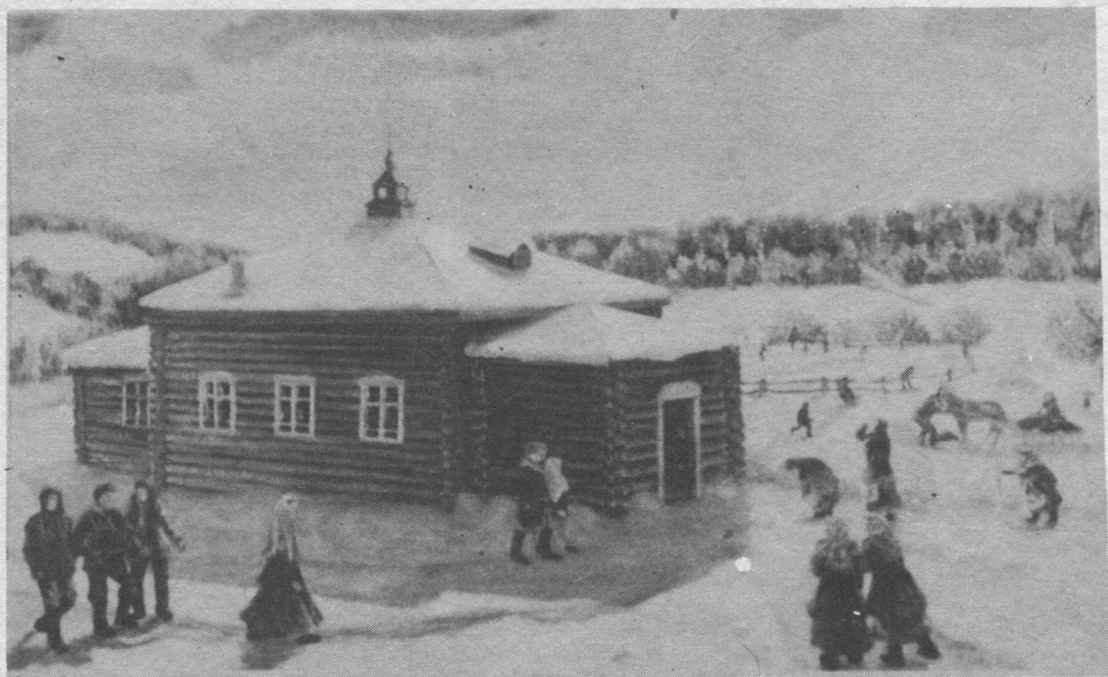
Розьдін (Изъвайыв) грездын вöвлöм вичко.