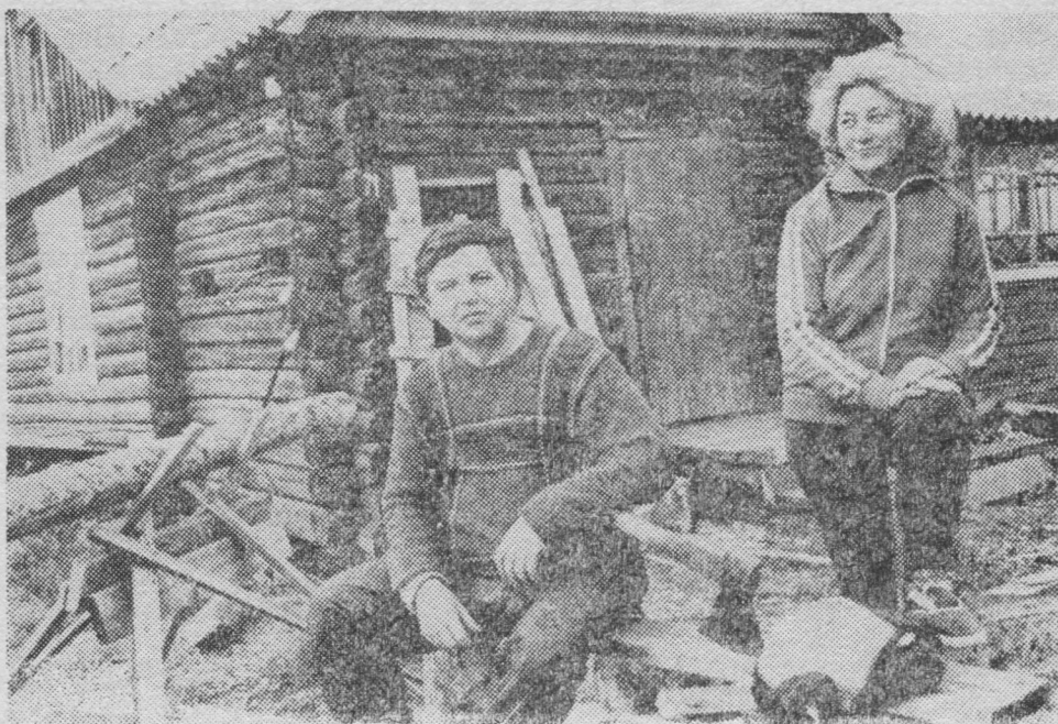
Снимок вылын: поэт А. Некрасов гётырыскöд.