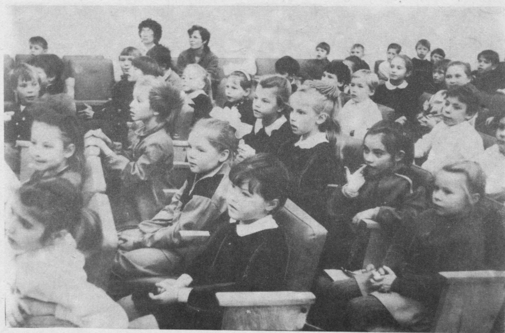
Школаыс выль, но челядь ӧткӧдӧсь быдлаын... Чӧв-лӧнь пуксис — мыйкӧ кӧсьӧны петкӧдлыны.