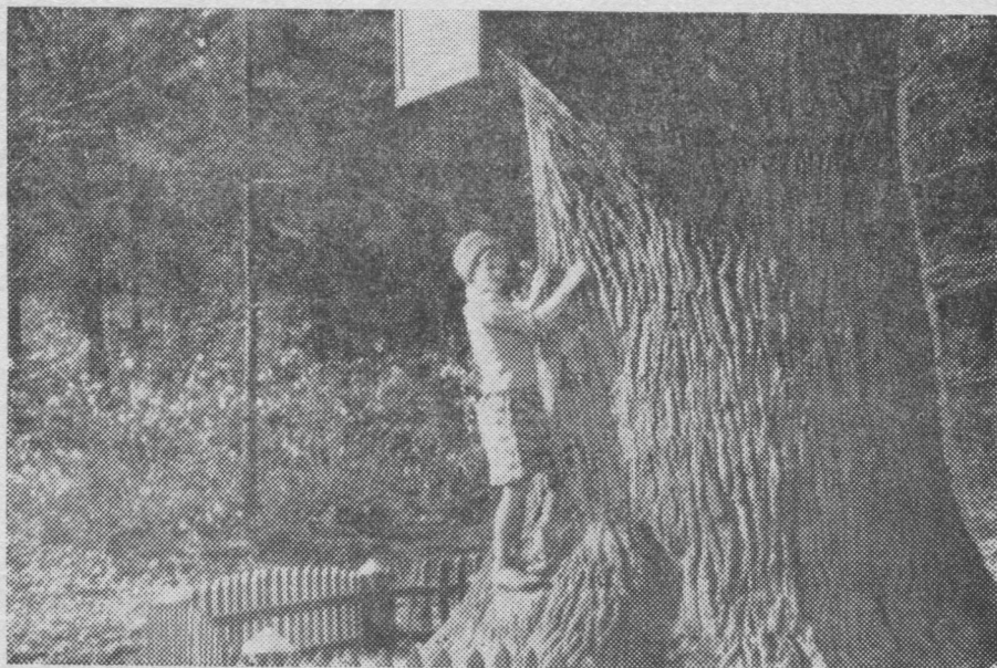
Тайö тупуыслы 375 арöс.