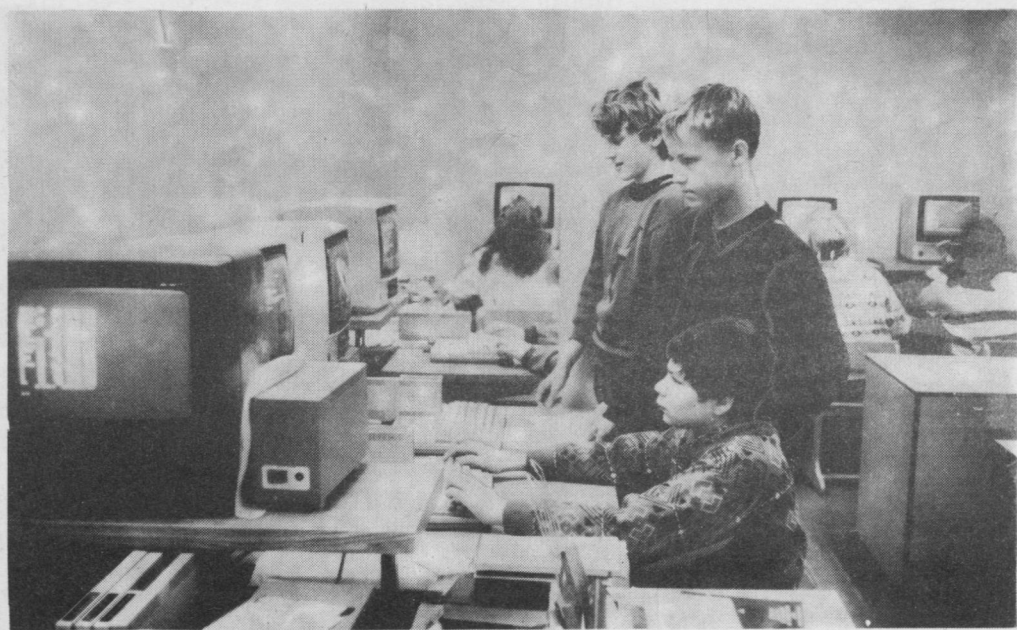
Пырӧдчам рынокӧ... А компьютер тӧдтӧг том мортлы вӧчны сэн нинӧм.