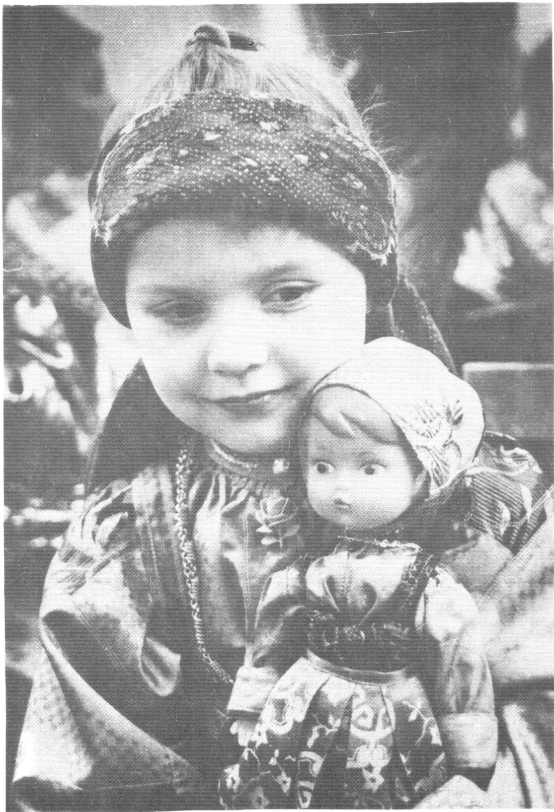
Усть-Цильмаса нывка аслас радейтана аканьскӕд.