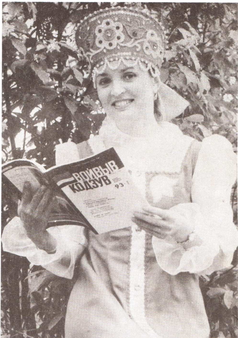
СУДЗӨДӨЙ ДА ЛЫДДЬӨЙ «ВОЙВЫВ КОДЗУВ».