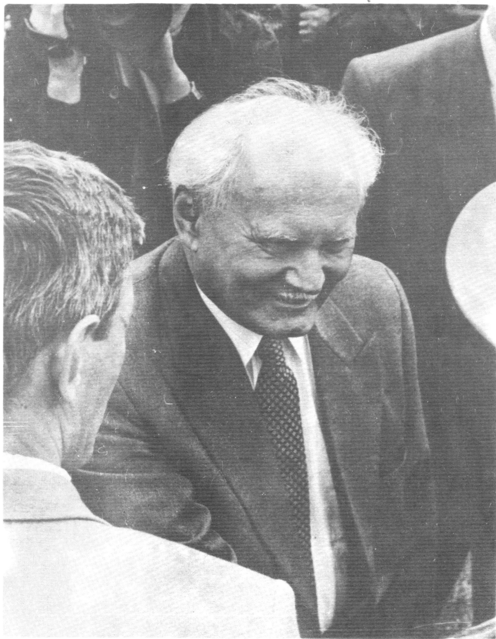
1993 вося июньын Коми Республикаб воліс Венгерскöй Республикаса Президент Арпад Гёңц (снимок вылын).