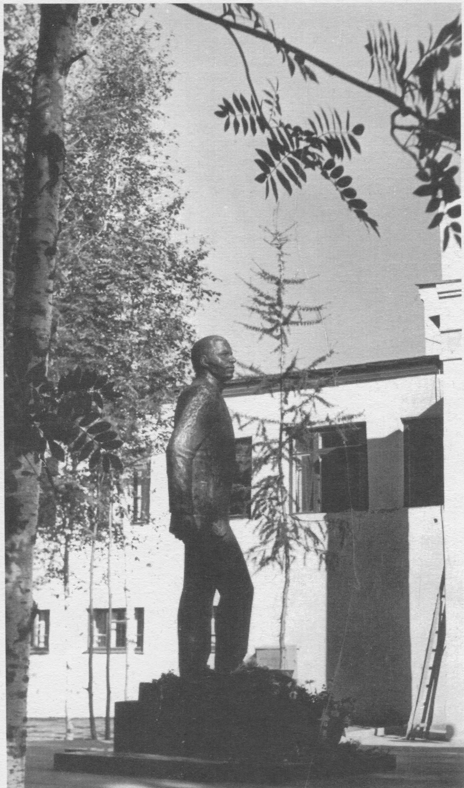
Бронзайсь кистьом Нёбдинса Виттор нэмьяс кутас сулавны Сыктывкарын сы нима академическóй театр дорын.