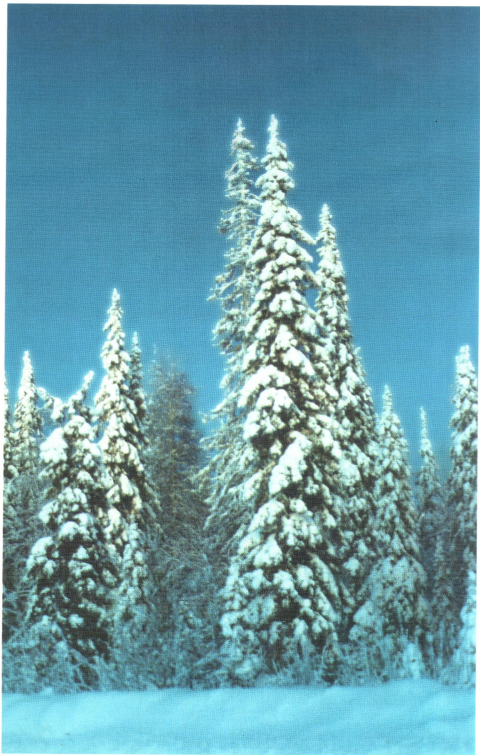
Снимокъясъс Г. Лисецкийлѳн.