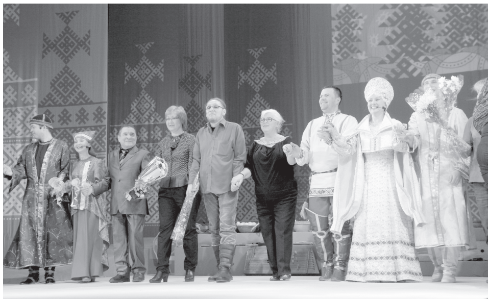
Снимокъяс вылын «Парма лов» спектакльӧн премьеры.

«Парма лов» велӧдӧ бурӧ: геройяс венласьӧны лёк вынкӧд шаньлунӧн да вежӧрӧн, корӧны отсӧг вылӧ Енмарӧс, вӧрӧгъяскӧд оз тышкасьны, кӧть и вынаӧсь, а унмовсьӧдӧны найӧс. И биармияса войтыр, кодъяс вӧліны Яурлы паныд, пондӧны ӧртасьны ськӧд да локтӧны ставӧн кӧлысь вылӧ.