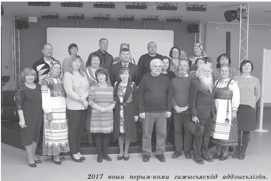
2017 воын перым-коми гижысьяскöд аддзысьлiгöн.