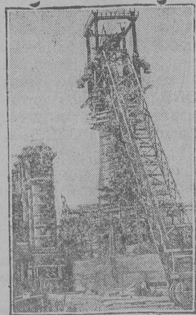
Көрсөһса чугун вөчан завод-ын помаөсө ыжыд вьлө домна. Сіјө домнаыс вөнас кутас лөңны 80 сурө тонна чугун.

Пјатөгорск. Һөрсөкөј округын мукөд рајонјасас шөркодө-ма олыөјасөсө пөштө һөтө оз кысыны колхозјасө. Прох-лабһөһнөскөј рајонын вьлө өтут-чөмјасөсө кысөма 191 овмөс, а сені сөмын һөл шөркодө-ма овмөс. Георгіјөвскөј рајонын, Ново - павловскөј стантөсіја-вылын вөстөма еө-һнөңөј төварішщөство. Сені ужалө тракторнөј колонна. 157 овмөс-һыө һөтө шөркодө-ма олыөсө сетчө абу котыртөма.