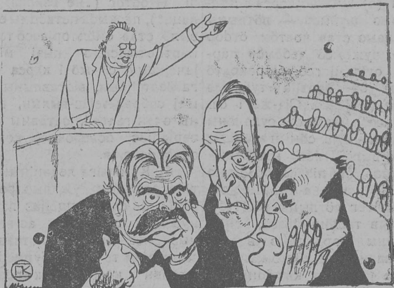
Өкүјүтчасны-жө бөльшөвөкјасыд! Мө өрүжөјасөсө пыр сөдталам, а һајө щөктөны бөырөдны.