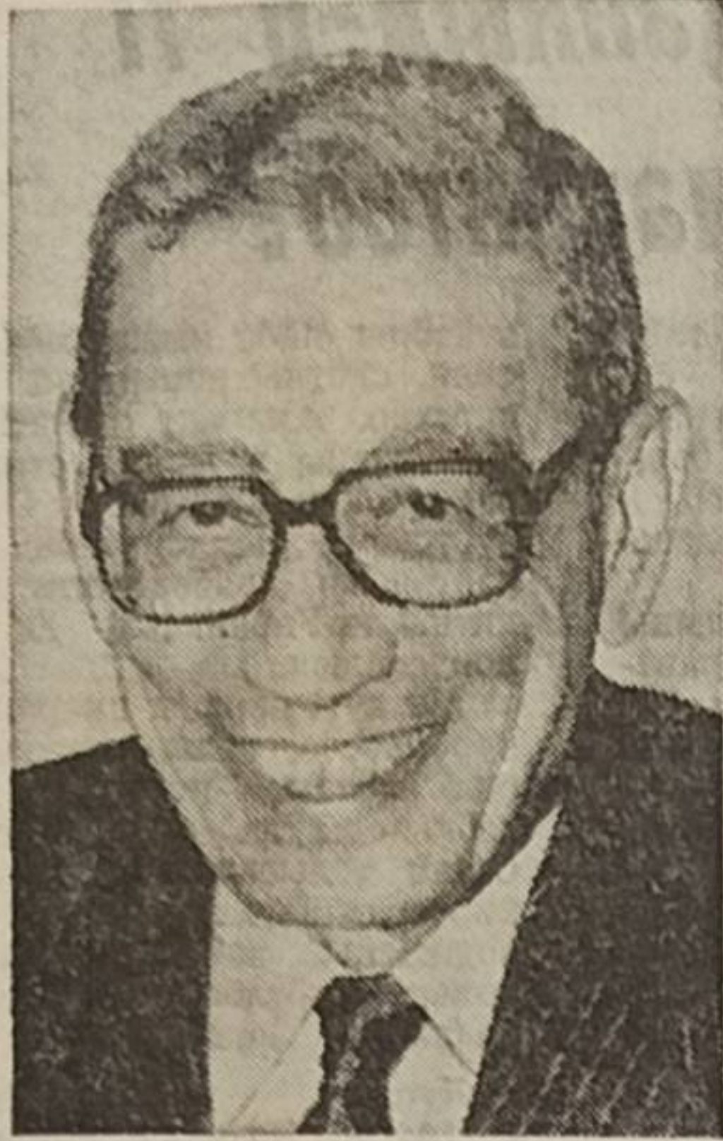
1992 вося январь 1 лунсянь ООН-са Генеральной секретарьон лонс Бутрос Гали — Египетса государственной деятель, тэдчана юрист.