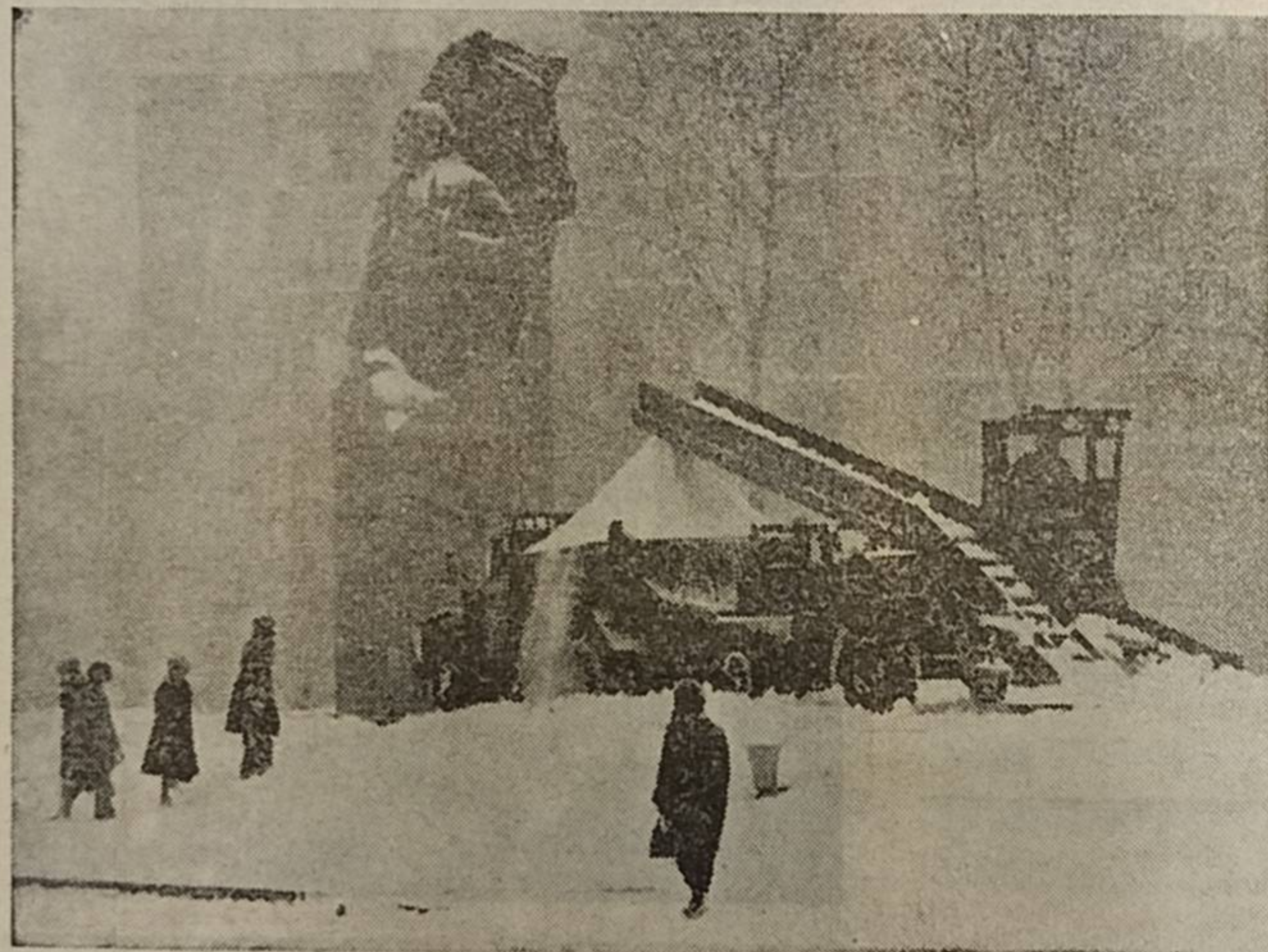
СЫКТЫВКАРЫН ТУРБА ЛУНБ.