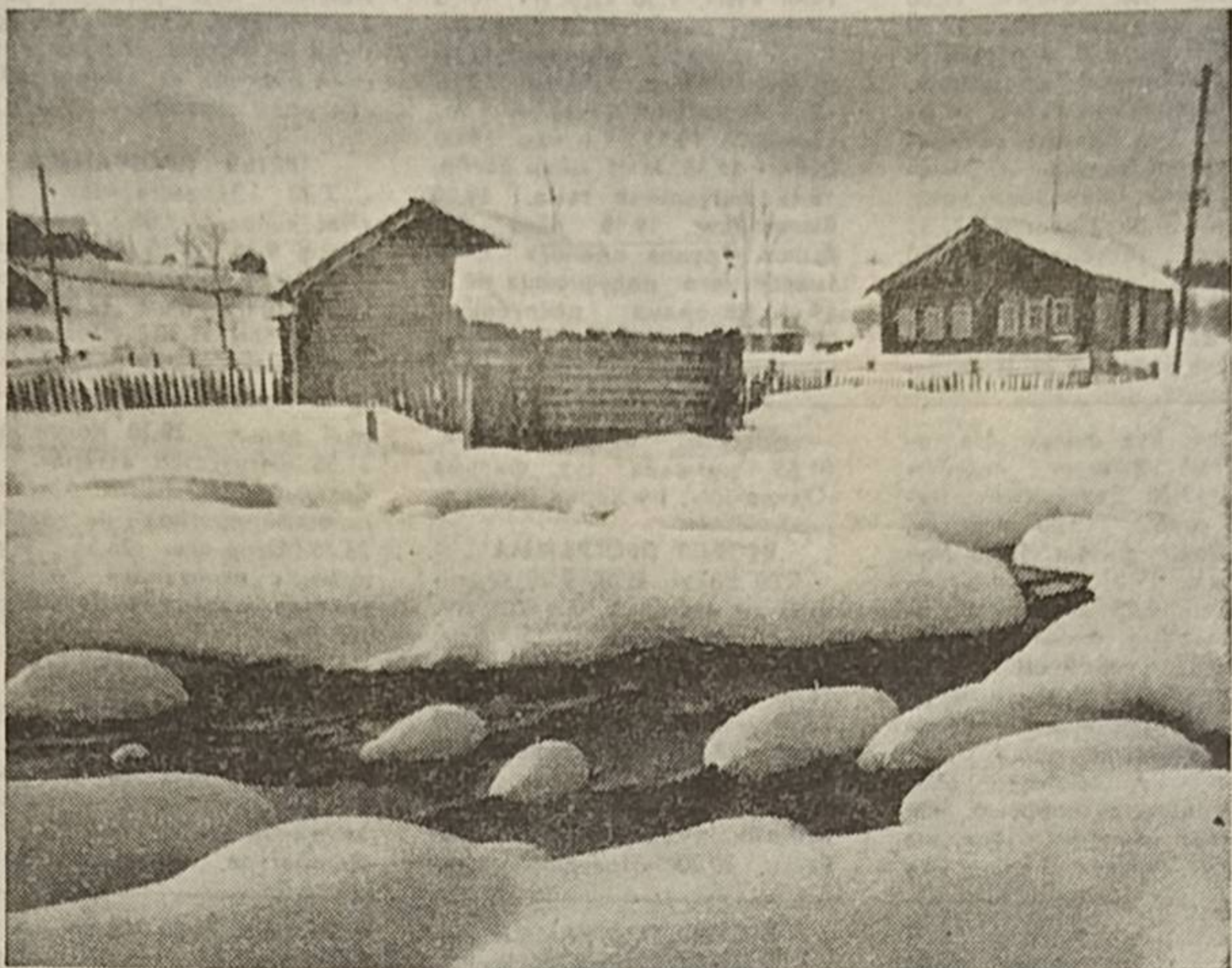
СЕРЕГОВ. (Княжпогостской р.)