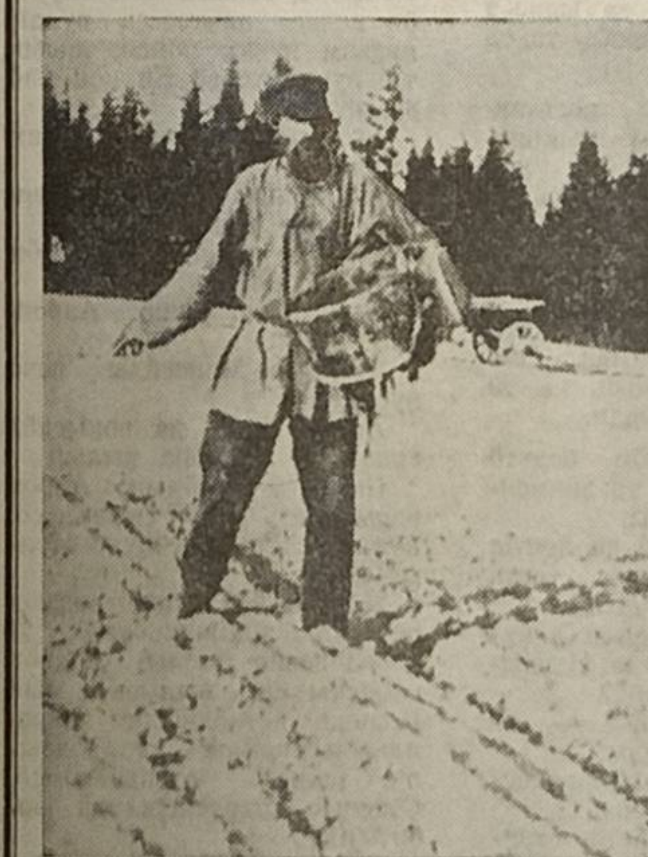
Көдзысы, Костромскөй губерния, 1911 во.