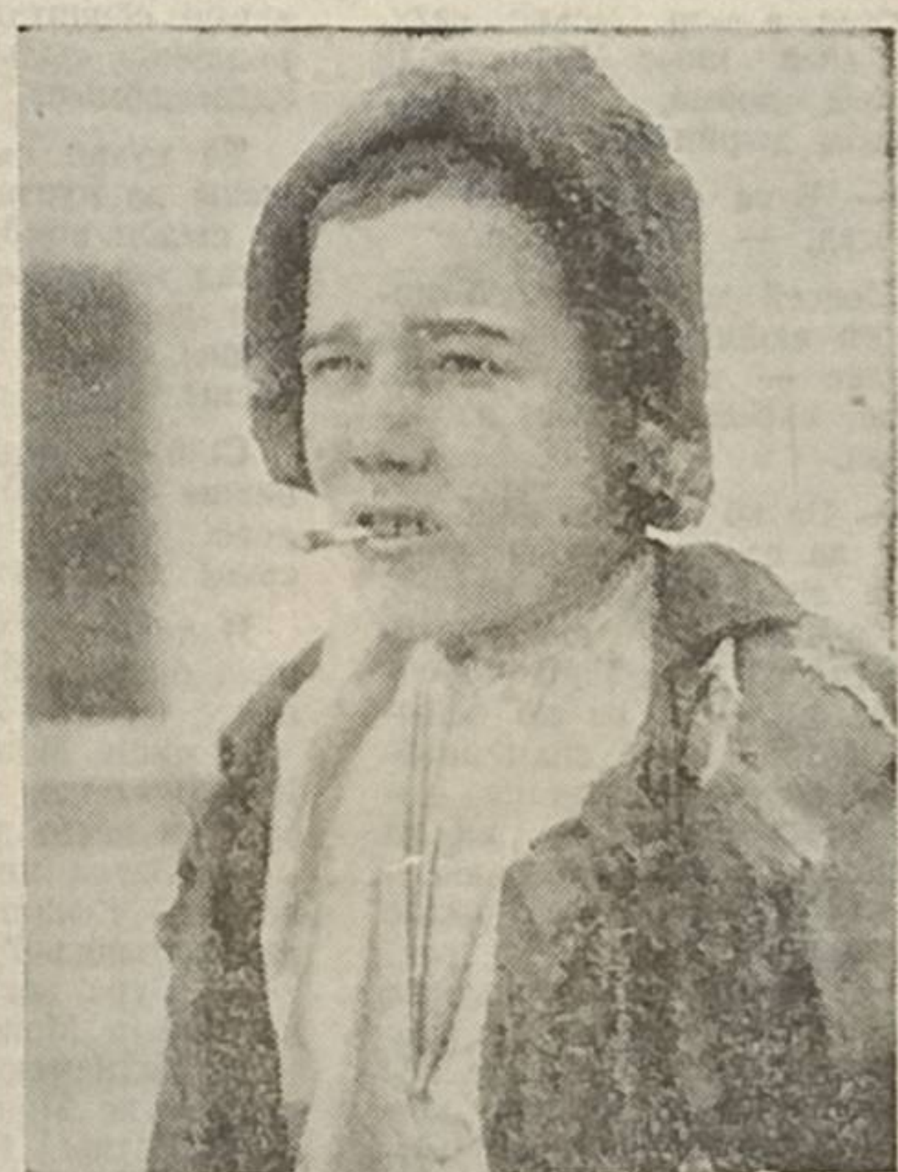
Бесирзорник, 20-өд вояс. (ТАСС-лөи фотохроника).