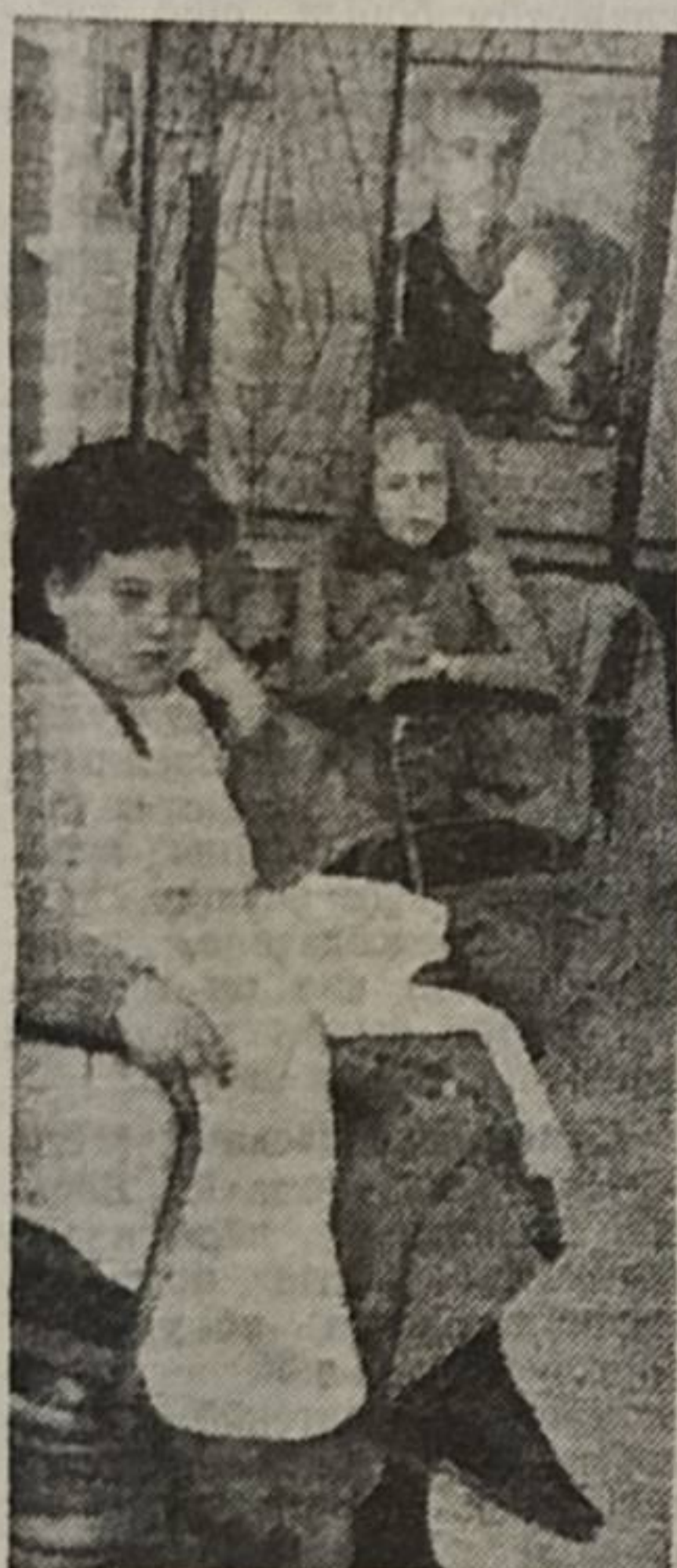
НОВГОРОД. Мужичбйяслбн «Волхов» парикмахерскойн неважбн на некор вблй весь овны мастерьясы. Но бнйя доньясыс «кбдзбдсны» татчэ волясысб. Шырсыны пыралб лыда морт.