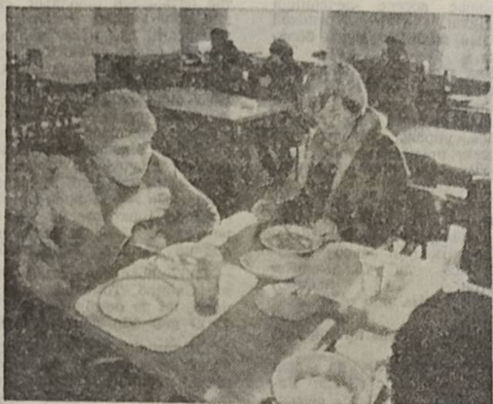
ЧЕЛЯБИНСК. Пенсионеры, школьники, инвалиды волевыми глыбы 18 номера столовой, код восток Тракторозаводской район. Вольгаис — шид, рок, чай, шомка капуста. Но и тамь уджид атть висталбны йбзыс. Челябинский восток коньямыс татшм столбвой. Сэтчэ денгасэ сетны милбсть фонд, карса администрация бердын йбзэ социальнй дорьян отдел, а сідзжэ торья йбз.