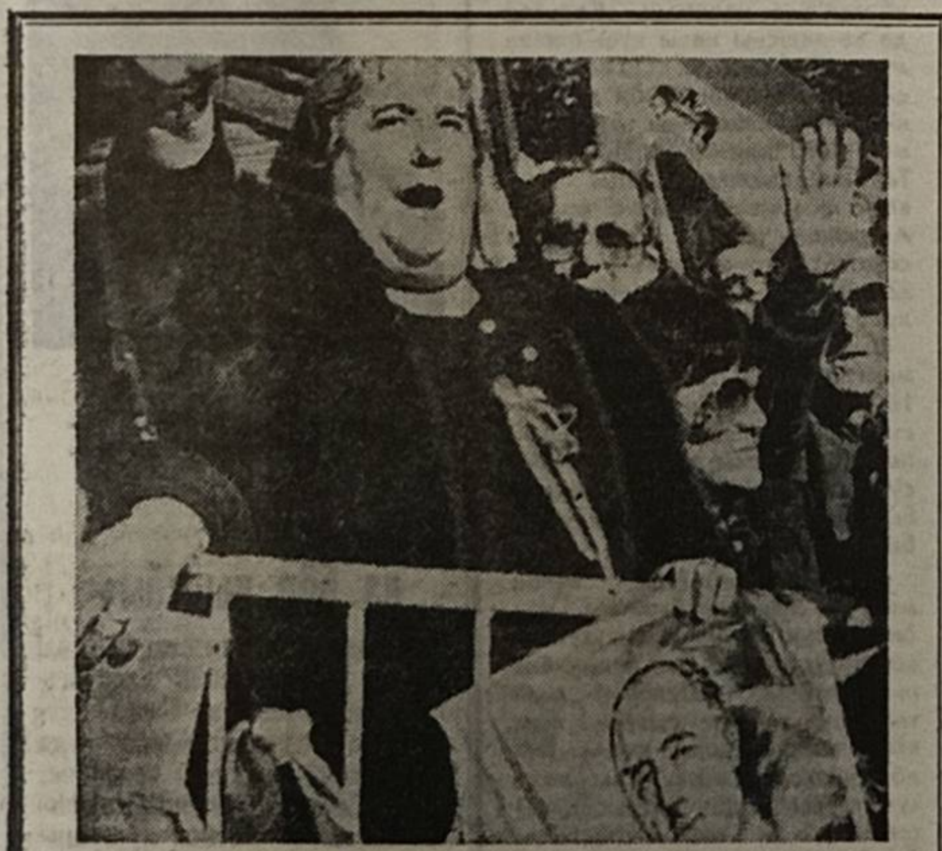
Германиясы, Франциясы, Италиясы да Европа са мунб государствосыс уна ультраправбй чукүртчылс нованбн Мадридб, медым казтывын диктатор Франкобс. СНИМОК ВЫЛЫН: асламыс чукүртчылбн ультраправбйяс нимбдисны медббрыя фашистскый диктаторсб.