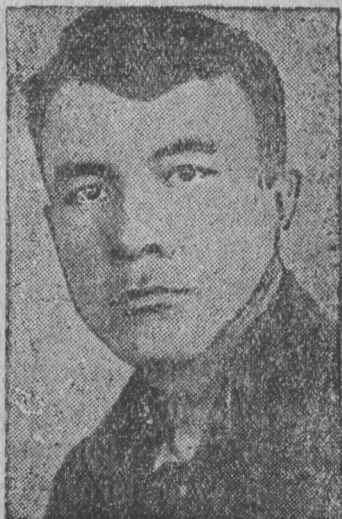
ВӨРЛЕҘЫҘ-СТАХАНОВЕЦ ТЫҘАЧЫК ПАЛАҘҘАСА „ИСКРА“ КОЛХОЗЫҘ (СЫКТЫВ РАЈОН)

јаслыс, Јарковлыс, Завјаловлыс, Кіпрушевлыс, Морозовлыс, Шамановлыс, Кочановлыс, Раковлыс да сојасөн мукөдјаслыс, кодјас сезон чөжөн сетөны сурс і унжык кубометр экспортнөј вөр.