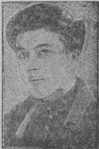
ВӨРЛЕҘЫҒ-СТАХАНОВЕЦ- ТЫҒАЧЫК НОҒИМСА ЛЕҘИҢ ҠИМА КОЛХОЗЫҒ (КУЛӨМДИҢ РАЈОН)

предпријатіејас вылын, транспорт да строітелство вылын, колхозјасын. Тышкасөј вөрлеқан план да заводјаслығ производственнөј план содтөдөн тыртөм вөсна, ыжыд удојност да озыр урожај вөсна. Јонжыка паскөдөј марксістско-ленінскөј велөдчөм да ужалығ јөзөс интернаціо-налізм самөн воспітајтөм.