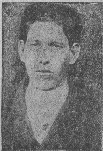
МЕЖАДОР ВОРПУНКТСА ВОРЛЕҒЫҒ-СТАХАНОВЕЦ ТЫҒАЧЫК МЕЖАДОРСА „ГОРД ПАРТИЗАН“ КОЛХОЗЫҒ (СЫКТЫВ РАЈОН)

прөчент челаџс да закрепитны всеобшцөј на- чальнөј велөдчөм.