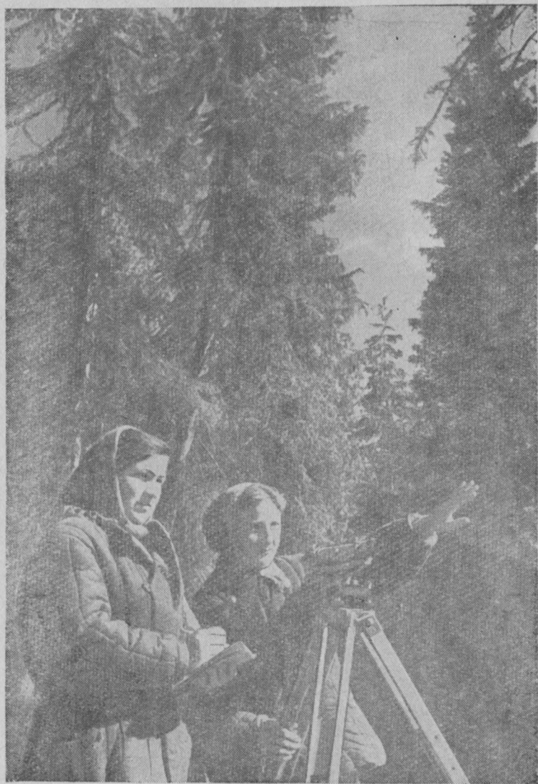
Туй пискӧдчис пемыд вӧр пӧвстті.