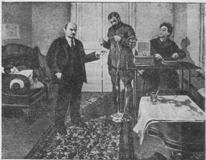
В. И. Ленин прямой провод дінын. Художник И. Грабарлөн картина.

тöны став ёртъяс, кодъяс волісны сэки Владимир Ильич ордö. «Будкаын» вöлі лöсьöдöма телефонной йитöд народной комиссаръяслөн кабинетъяскöд да квартираяскöд, РКП(б) ЦК-көд, Красной Армиялөн штабъяскöд, Петроградкөд, Харьковкөд да мукөд каръяскöд.