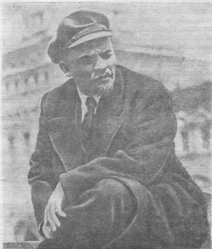
Всеобуч войскалөн парад. В. И. Ленин пукалө грузёвик вылын, кытысянь сійö висьталіс речь. 1919 вося фото.