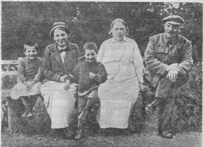
В. И. Ленин, Н. К. Крупская да А. И. Елизарова шойччоны Горкиын. 1922 вося фото.

2 часодз да 6 часьянь 8 часодз. Сэк жö, вöскресенньö- ысь кындзи, вежонас ещö öти лун уджавны ньöти эз позь. Владимир Ильич бöрйис серöда. Но 11 час пыдди Владимир Ильич воліс аслас кабинетас 9 час 30 мину- тын да лыддывліс сылы воём став газетьяссö.