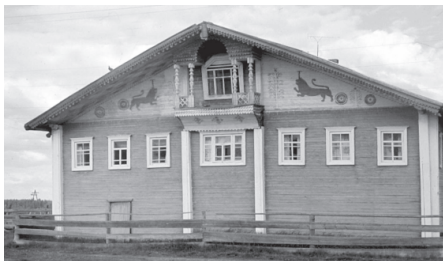
Пу серөдөм фронтона коми зыряналөн традиционнөй керка, XIX нэм пом. Коми Республика, Удора район, Остров сикт. 1990 во.

повалъясö. Та дорö нöшта содтöд индывлісны и керка лэптан кадсö да месайыслысь пассö. Керка вевтъяс баситлісны дзульöн – князь кер вылын, гöгрöс, ёсь йыла, морт сяма мыгöра, серөдөм ичöt сюръяяс. Öклучина бок помъяссö тшöкыда серөдлісны пöлöс крестъясөн, чукыль-му-кыльöн, тыв серөн. Ва ворга помъяс, а сідз жö кильчö кутысь сюръяяс мичмөдлісны мылькъя да лöсалөм серъясөн. Карнизъяс да