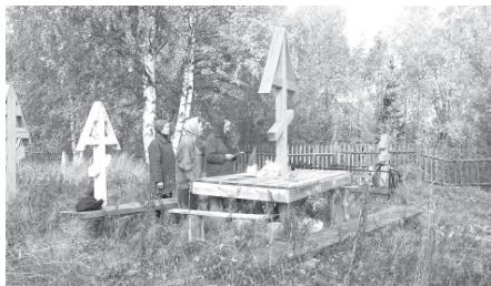
Кладбище вылын ёбетной крест дорын казтылём. Коми Республика, Кулёмдин район, Парч сикт. 2003 во.