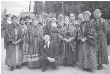
Удораса комияслӧн фольклорнӧй нывбаба котыр. Коми Республика, Удора район, Коптюга сикт. 2006 во.