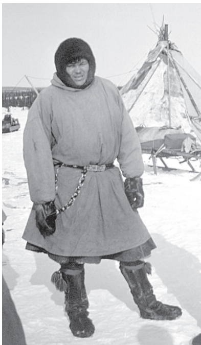
Ижмаса көрвидзысьяслөн көр куысь традиционной паськөм. Коми Республика, Инта район, Адзьвавом сикт. 1993 во.