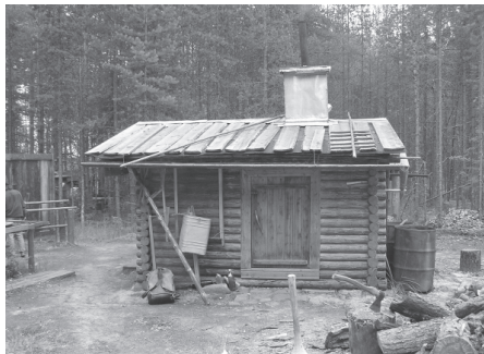
Печораса коми вӧралысьяслӧн вӧр керка. Коми Республика, Мылдин район, Якша сикт, 2006 во.