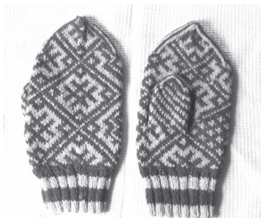
Традиционнӧй узоръяса кыӧм вурун кепысь. Коми Республика, Удора район, Чурово сикт. 2006 во. Фотоыс В.В. Власовалӧн.

идзсӧ. Айловъяслӧн иддзас пыр вӧлі сизим пӧвста дорӧс, а улыыс – тыв сера либӧ мӧд пӧлӧс. Эньлов чувкиын тыв сер вӧчлісны тшӧтш и иддзас. Ставнас идзсӧ вомӧна визьясӧн серӧдӧмаӧс новлісны олӧма аньяс. Ӧнӧдз на комиын оз позь пасьтӧдны поконицкы сэтшӧм чувки, кӧні эм пӧлынъ креста сер.