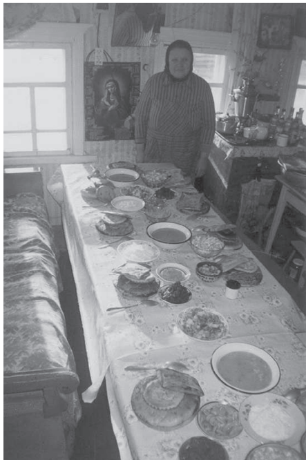
Традиционн й казтылан пызан удораса комиясл н. Коми Республика, Удора рай- он, Чупрово сикт. 2006 во. Фотоыс В.В. Власовал н.