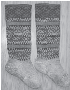
Удораса комияслӧн традиционнӧй узоръяса кыӧм вурун чулки. Коми Республика, Удора район, Вильгорт сикт. 2006 во.

луй баситӧмыс паськаліс тані ХІХ нэм шӧрын – ХХ нэм заводитчигӧн. Аслыссикасӧн лыддыссьӧ леткаса да лузасалӧн юрын новлантор, дӧрӧм, ки чышкӧд вышивайтӧм, кор дӧра юкӧнъясыс ставнас тупкысьӧны топыд серӧн. Тадзи дасьтылісны эньюлов юрын новлантор – сорока (небыд юркӧр-