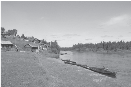
Печораса комияслӧн традиционнӧй пыжъ-яс. Коми Республика, Мылдин район, Усть-Унья сикт. 2006 во.