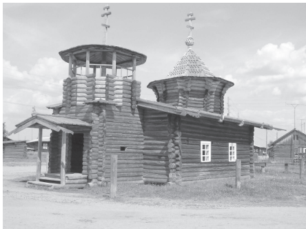
Параскева-Пятница часовня. Коми Республика, Удора район, Кривой Навёлк сикт. 2006 во.