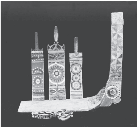
Пу вывті традиционнӧй серпас вьлысэж-васа комияслӧн, XX нэм. Коми Республикаса Национальнӧй музей.

Комияслӧн, кьдзи и мукӧд войтырыслӧн, важся удж сикасӧн вӧлі сӧй дозмук вӧчӧм. Тайӧ уджсӧ бергӧдісны эньювьяс. Весигтӧ XX нэм заводитчигӧн нин гырничьяс век на вӧчлісны важ ногыс – гартӧд бергӧдлӧм отсӧгӧн. Дозмуктӧ лепитісны тӧвся олан юкӧнын