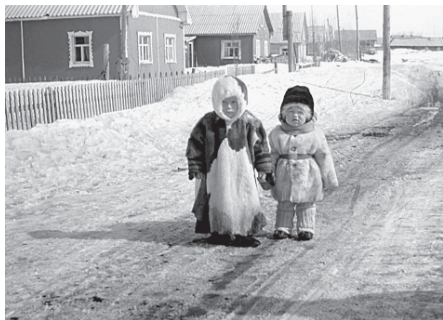
Детская меховая одежда ижемских коми. Село Петрунь, Интинский район Республики Коми, 1993 г.

15–20 см из летней шкуры оленя с более низким и плотным волосом. Обязательным элементом малицы стал пришитый наглухо капюшон ( юра малича ) с опушкой из меха по краю и вшитыми замшевыми тесемками, позволяющими регулировать степень открытости лица. Поверх повседневной малицы мужчины и в настоящее время носят сатиновый или хлопчатобумажный чехол-накидку ( малича кышед или кышан ), в целом повторяющий по покрою малицу. Многие муж-