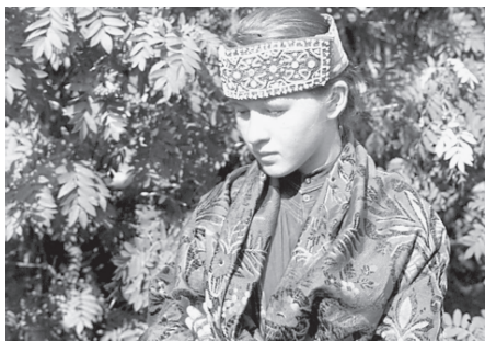
Бисерный орнамент на головном уборе невесты у печорских коми-зырян. Село Соколово, Печорский район Республики Коми, 1993 г.

(Ижма), юркөртөд или сорока (Прилузье, Сысола). Головные уборы на твердой основе – сборник (Вычегда, верхняя Печора), самшюра и кокошник (Печора, Вычегда, Вымь). Сборник имел коническую форму и состоял из мягкого чепца и твердого околышка. Самшюра – чепец неправильной трапециевидной формы, сшитый из кумача, с твердым дном, по краям обшит твердым валиком. Кокошник представлял собой чепец, сшитый из кумача, на холщовой подкладке. Спе-