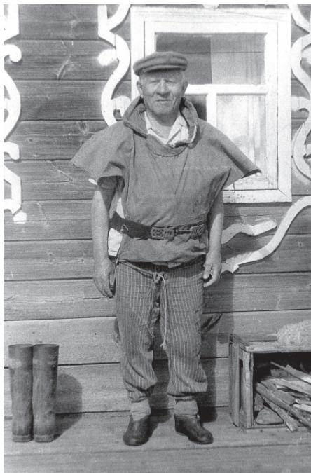
Традиционная одежда промысловиков у ижемских коми. Село Сизябск, Ижемский район Республика Коми, 1993 г.