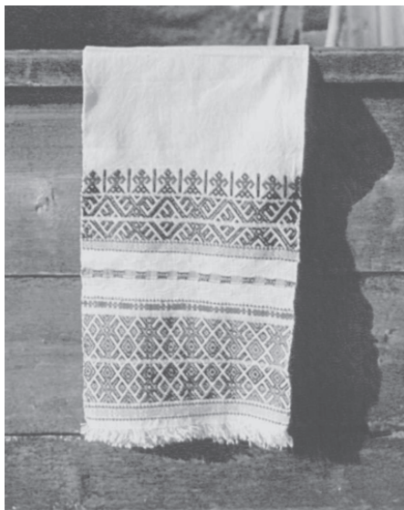
Традиционные тканые узорчатые полотенца. Село Чупрово, Удорский район Республики Коми. 1993 г.

мя видами браной техники – одноуточное и двууточное, которая характерна для населения западной части