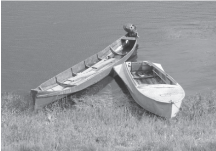
Традиционные и современные лодки удорских коми. Село Пысса, Удорский район Республики Коми. 2007 г.