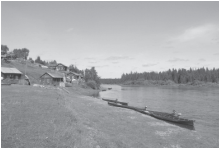
Традиционная лодка печорских коми. Троицко-печорский район, с. Усть-Унья, Республика Коми. 2006 г.