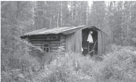
Традиционная охотничья избушка. Село Покча, Троицко-печорский район Республики Коми, 2007 г.