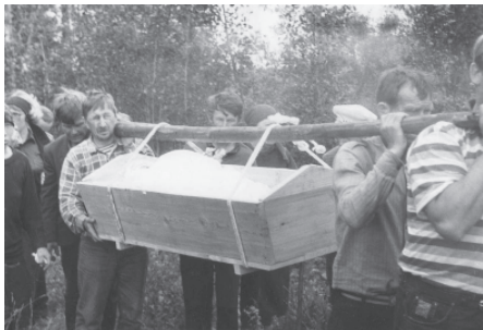
Похороны в с. Соколово. Печорский район Республики Коми, 1997 г.