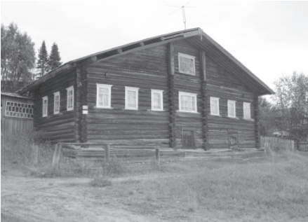
Традиционный дом удорских коми. Село Кослан, Удорский район Республики Коми. 2007 г.