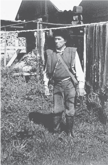
Традиционная одежда промысловиков у летских коми. Прилузский район Республика Коми, 1993 г.