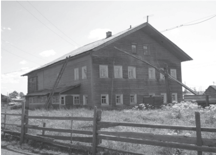
Традиционный дом ижемских коми. Село Ласта, Ижемский район Республики Коми, 2007 г.