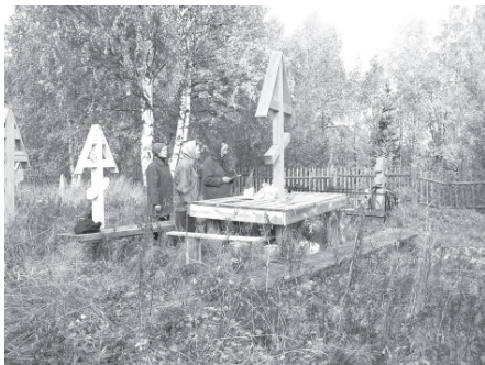
Поминки у обетного креста на кладбище в с.Парч, Усть-Куломский район Республики Коми. 2003 г.

живых и мёртвых доминировали над христианскими представлениями о пребывании душ умерших либо в раю, либо в аду.