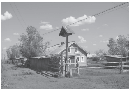
Обетный крест на въезде в с.Гам. Ижемский район Республики Коми, 2007 г.