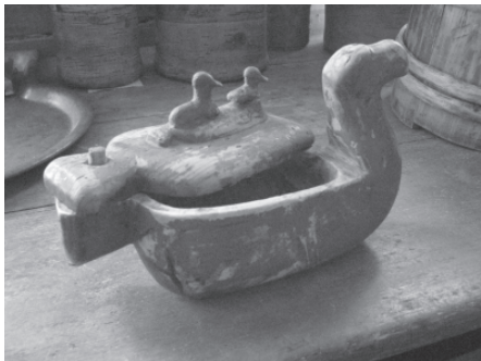
Деревянная солонка в виде утки. Село Ижма, Ижемский район Республики Коми, 2007 г.

ским делом. Практически каждый взрослый крестьянин владел технологией и навыками работы по дереву и был способен изготовить из него любой предмет, необходимый в личном хозяйстве. Вплоть до середины XIX века в деревообработке у коми преобладали простейшие технологические операции: рубка, обтесывание, долбление, сверление. Основными рабочими инструментами были: топор ( чер ), тесло ( керанчер ), скобель ( гöгын ), долото ( öжин ), резец ( кандрас ) и нож