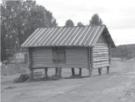
Традиционный амбар на столбах. Село Якша, Троицко-печорский район Республики Коми, 2006 г. Фото В.Э. Шарапова.

также пывсян (банька). Охотничья избушка представляла собой бревенчатую постройку 3х3 или 3,5х3,5 м высотой 2–2,5 м. Наиболее крупные по размеру избушки редко превышали в длину и ширину 4,5–5 м. Основная, или базовая, вөр керка обычно имела также рубленные из бревен сени, находившиеся под одной с ней крышей. Сруб ставился прямо на землю. Крыша обычно была односкатной, для покрытия использовались доски, вытесанные из половинок бревна.