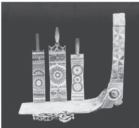
Традиционная роспись по дереву вычегодских коми, нач. XX века. Национальный музей РК.

воды и кваса, ведра, колодезные бадьи, ушаты, подойники, банные шайки, кадки, лохани и другая деревянная утварь из ели, сосны, березы, ольхи, осины. В начале XX века в пригородном селе Слобода выделкой деревянной посуды на продажу занималось до 30 человек. На Печоре спросом пользовались бочки для засола рыбы. Крупнейшими бондарными