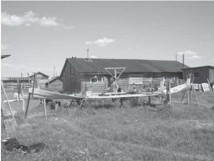
Изготовление традиционных лодок у современных ижемских коми. Село Ласта, Ижемский район Республики Коми, 2007 г.

ли запоры для ловли рыб. При передвижении на плотях отталкивались шестами. Использовали плоты и в качестве паромов.