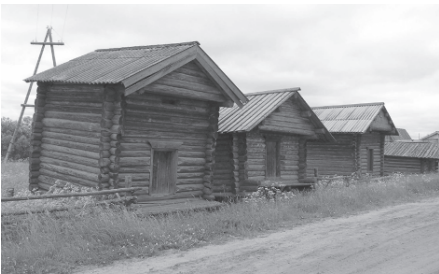
Традиционные амбары на столбах у удорских коми. Село Чупрово, Удорский район Республики Коми. 2006 г.