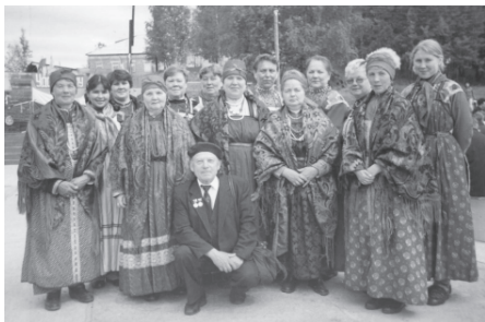
Фольклорный женский коллектив удорских коми. Село Коптюга, Удорский район Республики Коми. 2006 г.

ныне широко распеваются в коллективах художественной самодеятельности современные песни самодеятельных авторов. Все старое и новое в песенно-музыкальном народном творчестве составляет ценный фонд национальной музыкальной культуры народа коми.