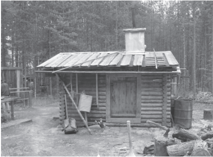
Современная промысловая избушка печорских коми-охотников. Село Якша, Троицко-печорский район Республики Коми, 2006 г.