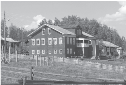
Традиционный дом ижемских коми. Село Мохча, Ижемский район Республики Коми, 2007 г.