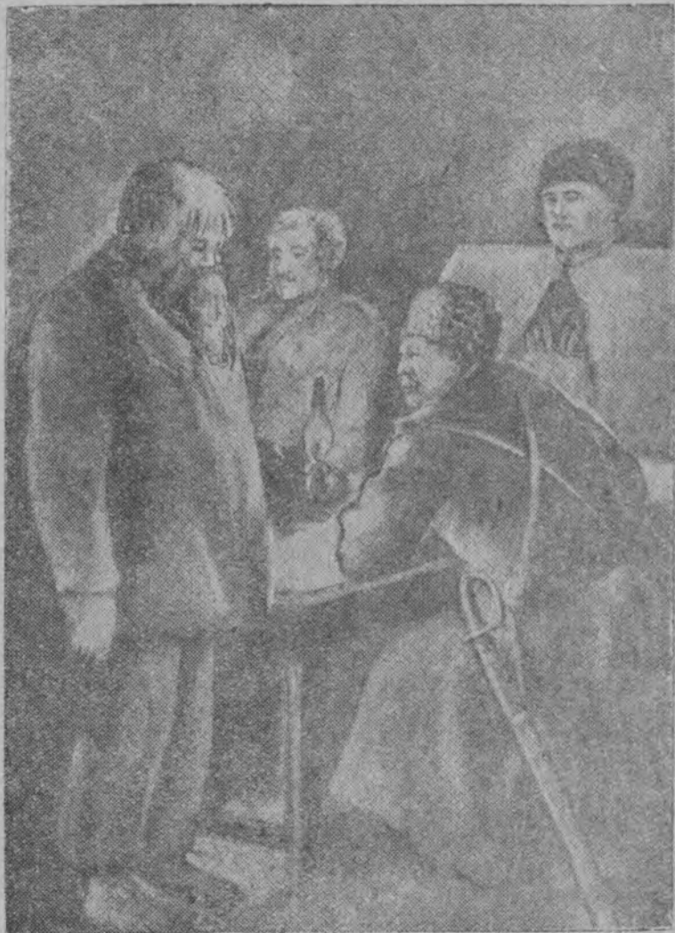
Эков висъталіс стариклы, мый сы водзын сулалö Доно-кубанскöй отрядъслөн тöдса атаман генерал Фрöлов.