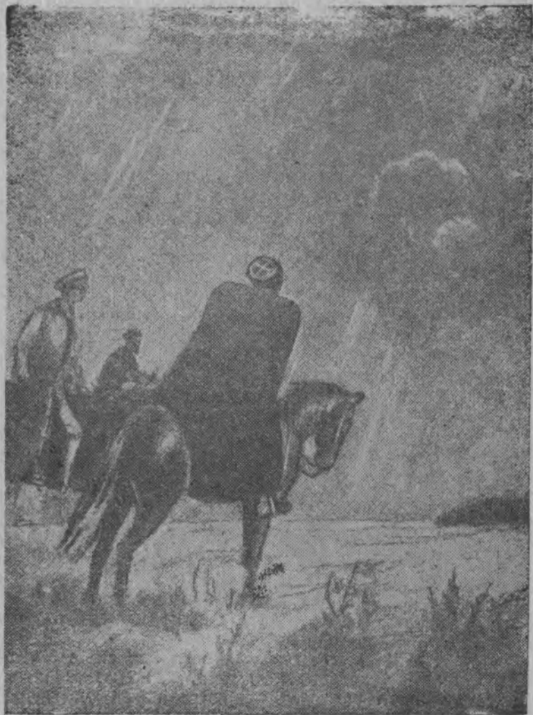
Вёрсянь некод эз тыдовтчы. Тайё кутіс лоны подозрительнойби.